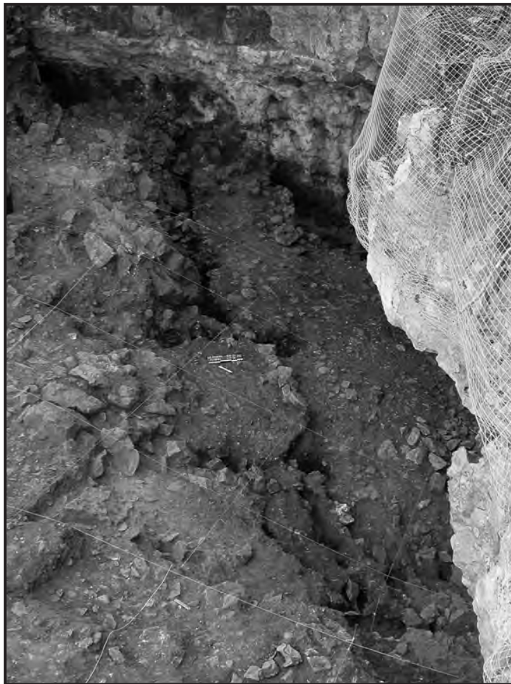
Fig. 3 – Tranchée du mur de La Tène moyenne

fréquentation apparemment réduite de la cavité attestent une ambiance plutôt aristocratique. À La Tène moyenne et finale, au contraire, l'allégement des structures, le report de l'occupation dans la grotte, où ont lieu d'importants dépôts de céramiques et d'outils, indiqueraient une fréquentation plus populaire. Compte tenu du caractère exceptionnel des aménagements reconnus dans l'avant-grotte à Agris, qui semblent encore inconnus ailleurs en Europe, cette hypothèse de travail devra toutefois être validée par la poursuite des recherches sur le site.