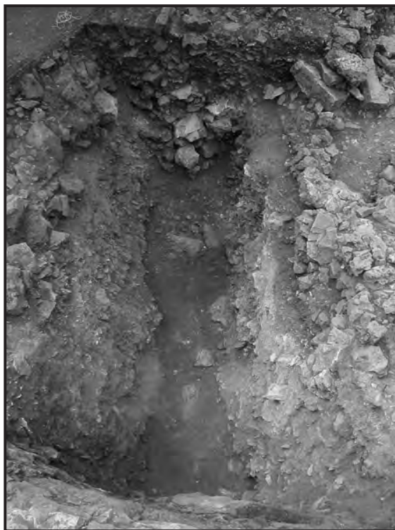
Fig. 1 – Fossé de La Tène ancienne : vue de la partie fouillée.

Pour l'instant, il n'est pas possible de dire à quelle époque précise ce fossé fut creusé, ni de préciser son fonctionnement, si ce n'est qu'il dut rester ouvert. Nous connaissons par contre mieux son comblement, qui s'apparente d'ailleurs à une véritable condamnation. Plusieurs arguments permettent d'affirmer que celle-ci fut très rapide et s'effectua en une seule opération.