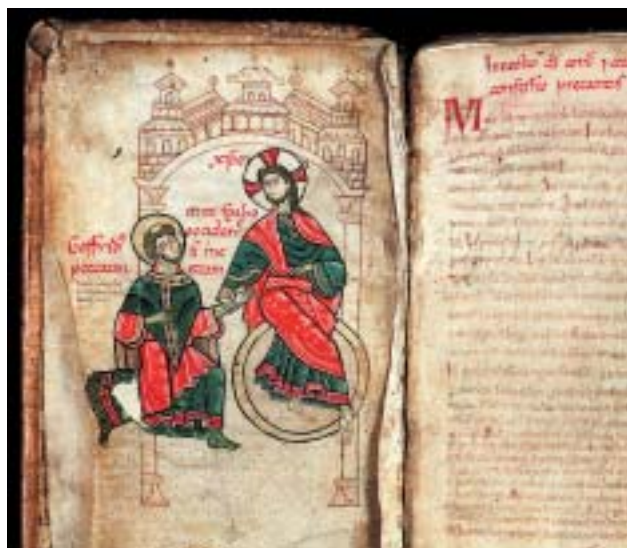
Geoffroy de Vendôme à genou au pied du christ; (Vendôme, Bibl. mun. 193, fol.2v)