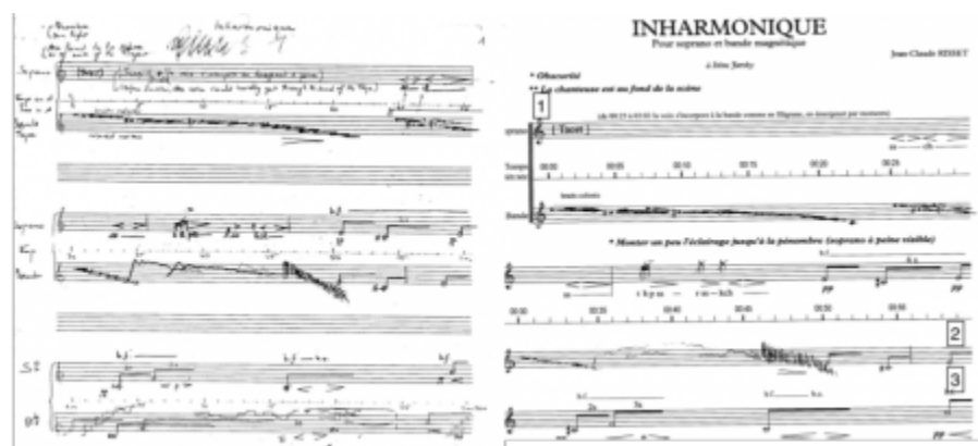
Figure 2. Comparaison des deux versions de la partition d' Inharmonique à partir de l'instant 10'06" ; version originale manuscrite (gauche) et nouvelle version (droite).

Partition manuscrite extraite des archives Risset (laboratoire PRISME, Marseille). Partition de droite : © João Svidzinski licence CC-BY 4.0