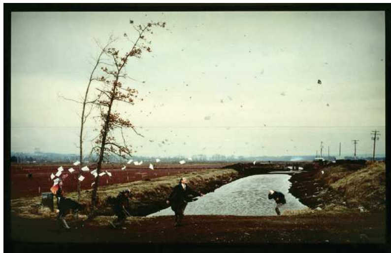
Figure 8 - A sudden gust of wind (after Hokusai)

Dans A sudden gust of wind , Jeff Wall a d'abord photographié des acteurs dans un paysage situé à l'extérieur de Vancouver, dans des conditions météorologiques semblables. Il les a ensuite insérés, comme d'autres éléments digitalisés, dans la photographie pour réaliser la composition. Le résultat est un tableau-photographie issu d'une mise en scène composée comme une peinture classique.