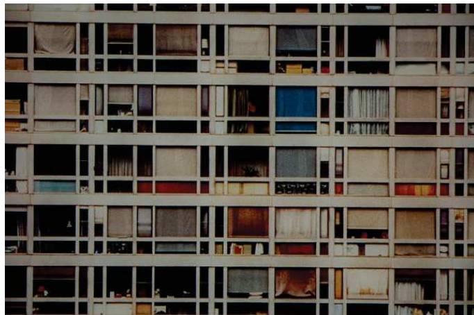
Figure 7 - Paris-Montparnasse , 1994 (détail)

© Andreas Gursky (impression C-Print, format 206 x 406 cm) Source : Museum of Contemporary Art (Sydney, Australia)