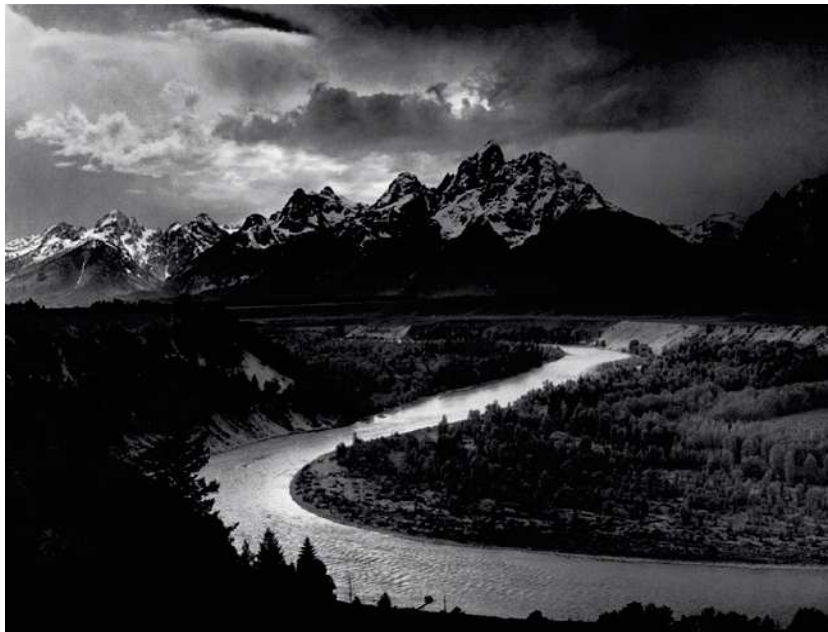
Figure 3 - Ansel Adams, 1942 (tirage gélatino-argentique) - The Tetons and Snake River, Grand Teton National Park, Wyoming, USA.

Source : © National Archives and Records Administration, Records of the National Park Service. (79-AAG-1) 10