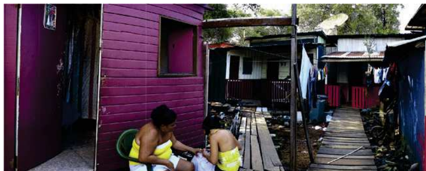
Figure 4 - Paysage urbain, quartier Mathina, Cayenne.

Tirage numérique sur Dibon. Format 30,4 x 75 cm