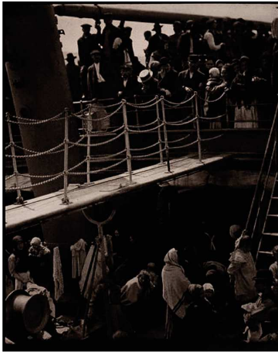
Figure 2 - Alfred Steiglitz. The Steerage 1911, prise de vue de 1907

Epreuve photomécanique (photogravure) sur papier japon. Format 33,2 x 26,3 cm.