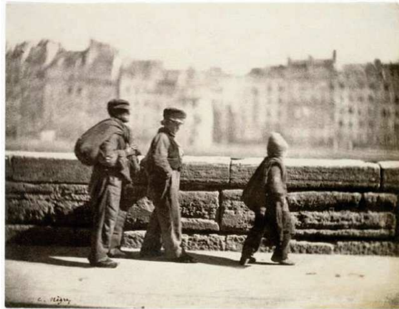
Épreuve sur papier albuminé d'après un négatif sur papier ciré, Format 15,9 cm x 21,7 cm

De nombreux historiens de la photographie (Whelan, 2000 ; Bauret, 2004 ; Naef, 1995 entre autres) considèrent qu'à partir de l'œuvre d'Alfred Steiglitz, deux courants esthétiques vont se dessiner : l'un valorise un travail formel ouvrant vers le paysage, la nature morte ou l'architecture et est très marqué par le lien avec la peinture et le mouvement pictorialiste. L'autre courant valorise le regard et l'action et ouvre vers le photojournalisme social utilisant des compositions formalistes d'un nouveau genre.