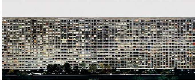
Figure 6 - Paris-Montparnasse , 1994

© Andreas Gursky (impression C-Print, format 206 x 406 cm) Source : Museum of Contemporary Art (Sydney, Australia)