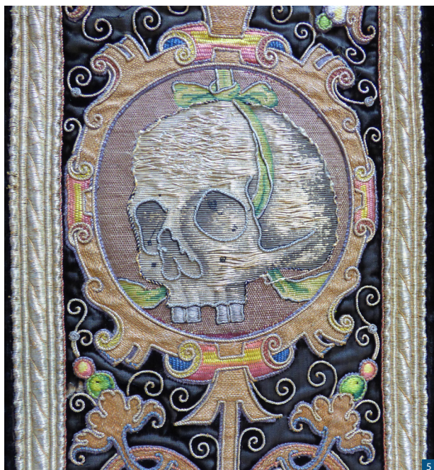
Bourse de jeu ou aumônière, cannelé brodé, XVIII e siècle (inv. Lair 919.13.3.203).

7 - Bonnes-grâces : rideaux étroits placés à la tête du lit. Pentas : bandes de tissus attachées à la partie supérieure et cachant le système de tringles sur lesquelles coulaient les rideaux.