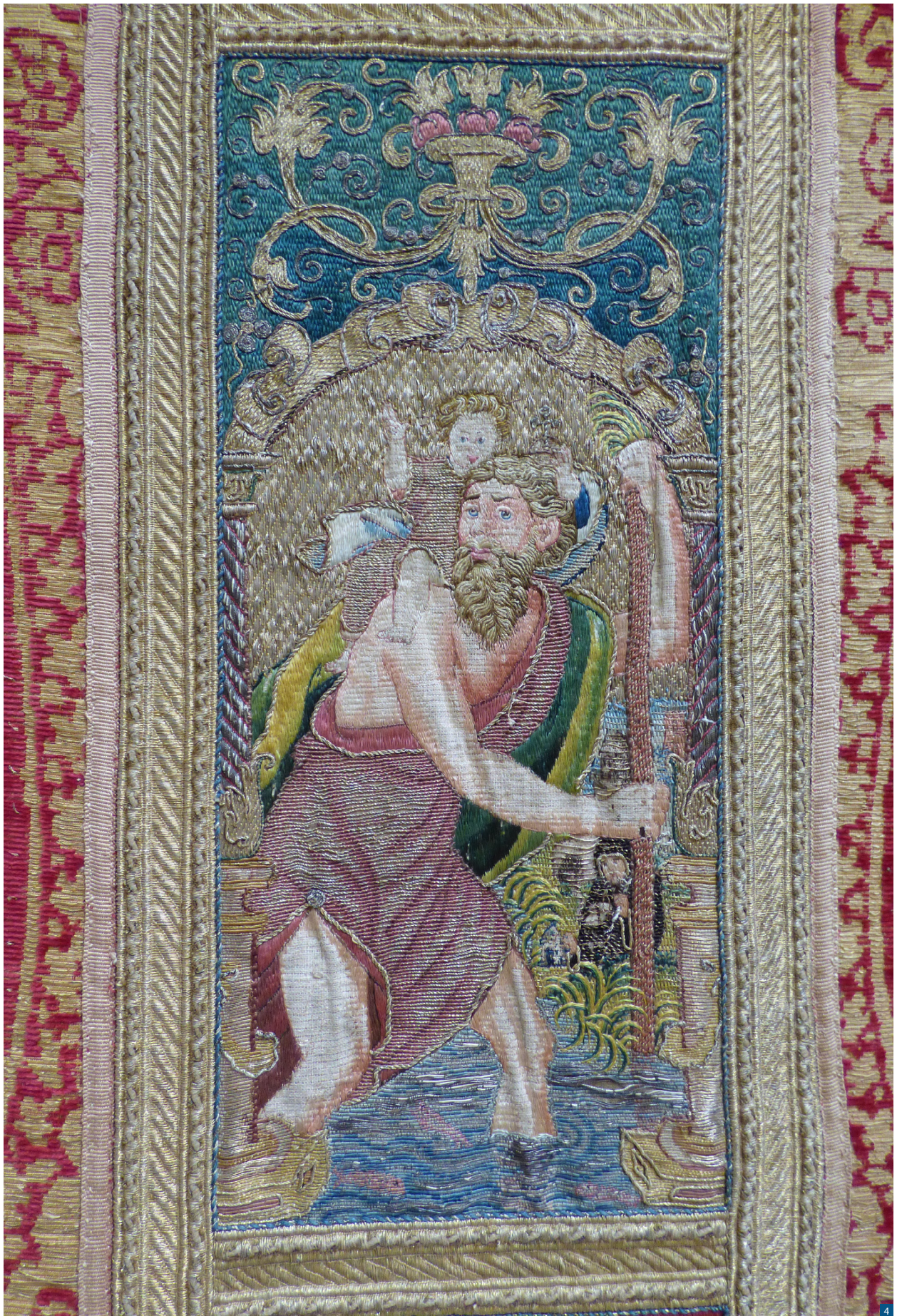
Saint Christophe, broderie en or nué, chasuble espagnole du xv e siècle (inv. Lair 919-13-3-10-1).