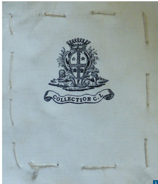
Étiquette cousue sur certaines pièces. Doublure de la chasuble (inv. Lair 919-13-3-10-1).