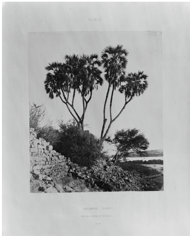
Kalabcheh (Talmis) – palmier doum et mimosa – Pl. 120 / Félix Teynard / Imp. Phot. de H. de Fonteny / Publié par Goupil et Cie éditeurs . (30,6 x 25,5 cm)

sensible , peut-être ethnographique et botanique . Au-delà des ruines antiques, il s'intéresse aux villages, à la végétation et aux paysages.