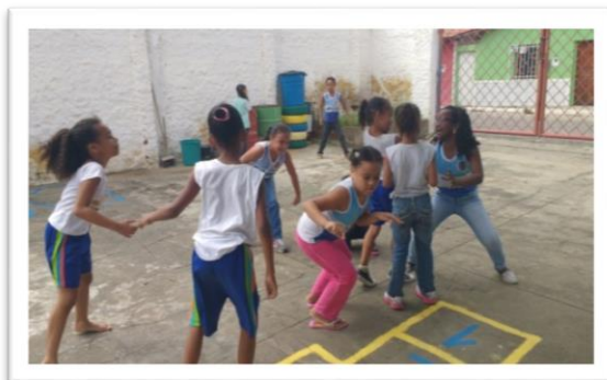
Figure 4. Jeu, danse et chorégraphie

« Une fois que la cloche sonne je regarde les enfants qui viennent à la terrasse. Beaucoup de gens vont à la cafétéria pour prendre une collation. Je vois les garçons venir dans la cour, Les filles aussi, une joie! Des garçons et de filles courent pour voir la nouveauté de l'école: un jeu de marelle peint sur le sol. » (Idem).