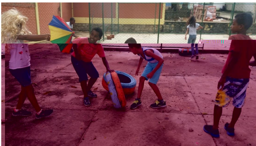
Figure 7. Jeu avec les pneus

Le deuxième jour d'observation du baú en activité a reproduit les mêmes sensations : joie extrême, presque une catharsis pour une partie des enfants et du côté des chercheurs, la panique. « Les premiers enfants qui sont venus dans la cour, où a été installé le BauBricante, ont eu le privilège de se servir des pneus, l'un des objets les plus recherchés. Ce fut le premier jour de fonctionnement après l'ouverture officielle du Baubricante, le vendredi , le 12 mai [...].Une fille a pris une perruque blonde, tout autre matériel de grand attrait avec lequel les enfants jouent ..." (Sandra Popoff, journal, 15/05/17).