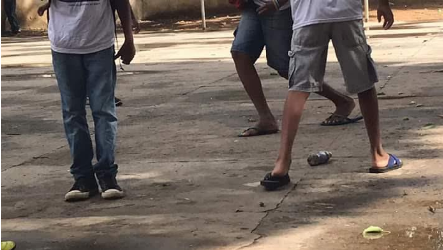
Figure 1. Jeu de foot inventé

Dans un espace réservé à la 1 ère année, le football avec la balle jaune circulait après les commandes du professeur d'éducation physique (une partie de foot était organisée par le professeur d'éducation physique). Les enfants tirent la balle vers le but sous la supervision de l'enseignant. Les filles improvisent d'autres jeux, avec danse et défilé. Un groupe de filles s'approche, mais elles sont invitées à partir. Le professeur ne sourit pas, il donne des ordres pour le jeu avec la balle jaune.