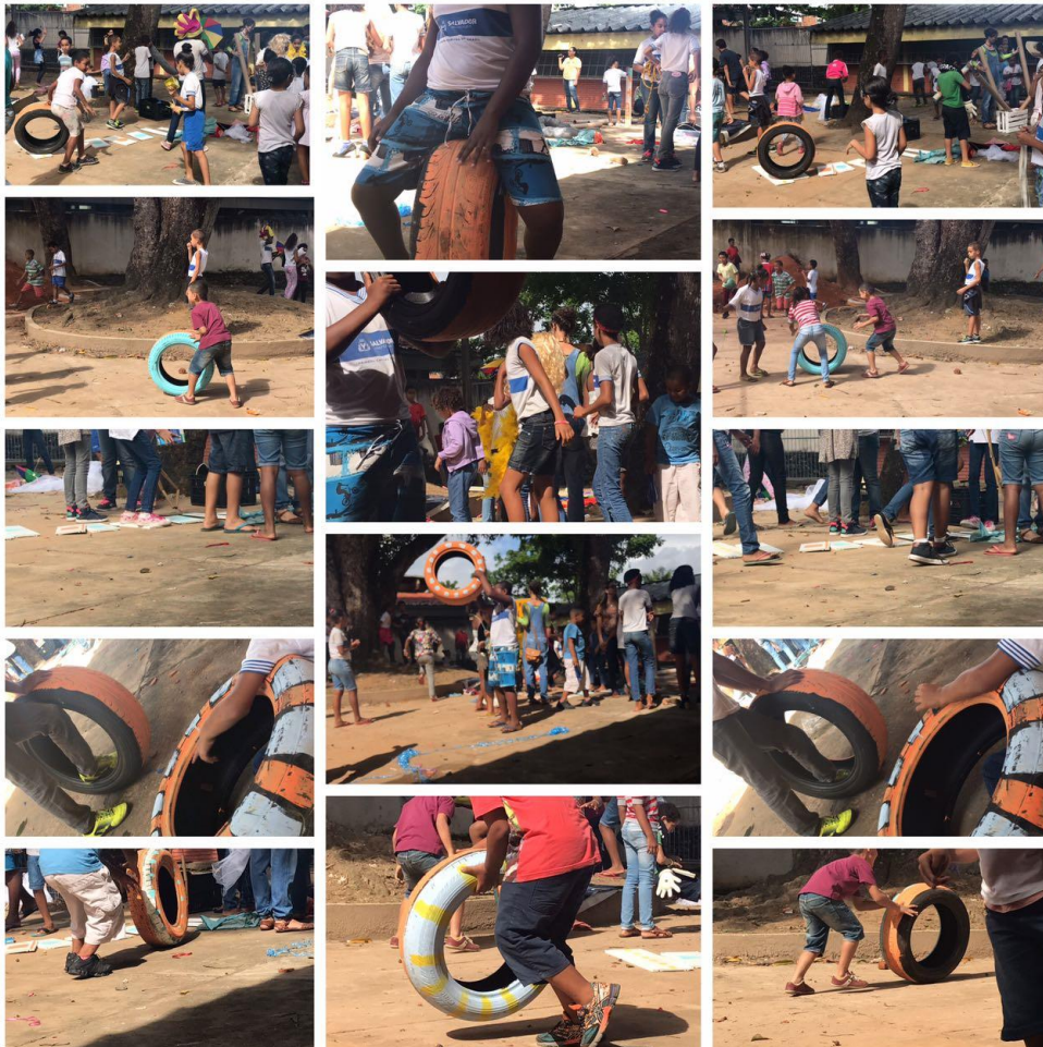
Figure 5. Baubricante

La mise en place de la boîte était prévue pour février 2017, mais finalement elle a été installée en mai 2017 (12/05/17). Les données que nous avons sur le jeu des enfants ne sont pas très nombreuses. Nous n'avons eu, effectivement, que quatre semaines d'observations depuis l'installation du "Baú". « Les chansons des enfants résonnaient dans la cour, une belle pause de pluie et on avait une journée pleine de soleil! Il est temps de célébrer la joie du temps! Le Baú Brincante a finalement été ouvert après une cérémonie d'ouverture rapide entre le son indistinct du bruit des enfants. Les ballons sont montés au ciel, la porte ouverte. [...] On a eu vingt minutes de mouvement intense [...] les enseignants marchaient avec des signes : c'est la fin de la récréation. Certains ont aidé à ranger les matériaux, d'autres ont couru; le premier jour du "Baubrincante" prend fin. » (Popoff, École Roberto, mai 2017)