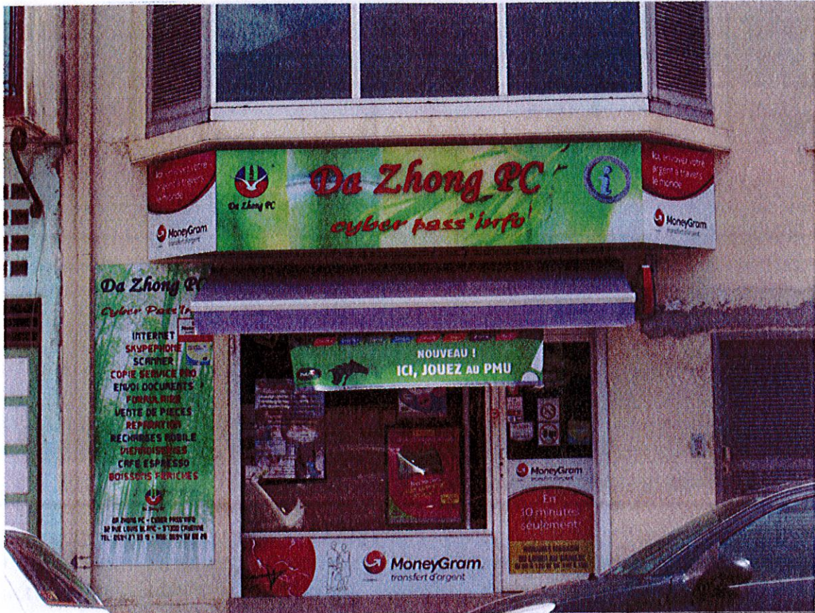
Siège de l'association AJE, Cayenne, Dubost, juin 2015