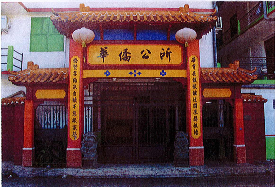
Siège de l'association Fa Kiao Kon So, Cayenne, Dubost, décembre 2012