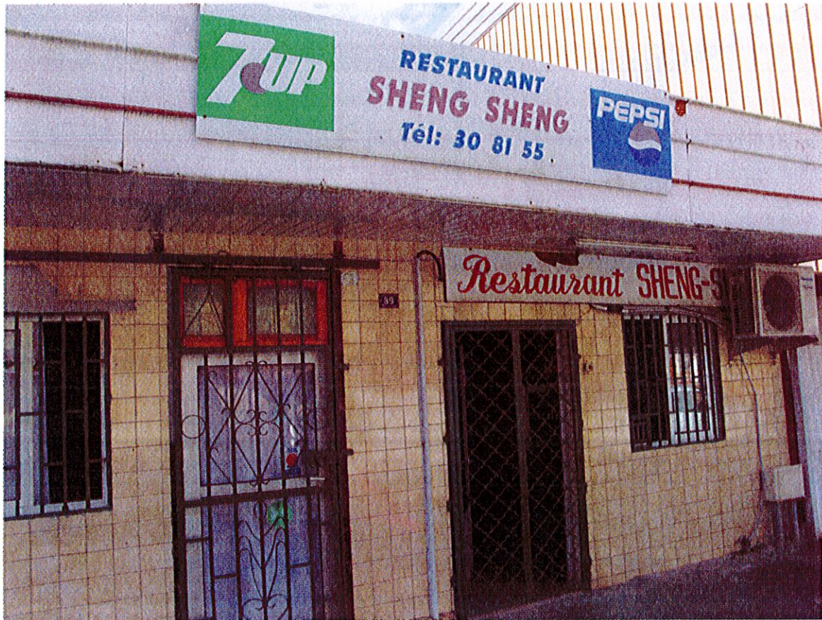
Restaurant Chinois (Sheng Sheng), Dubost, juin 2015