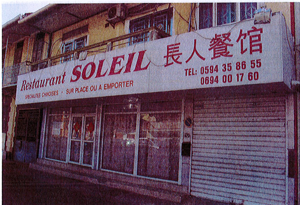
Restaurant chinois (Soleil), Cayenne, Dubost, juin 2015