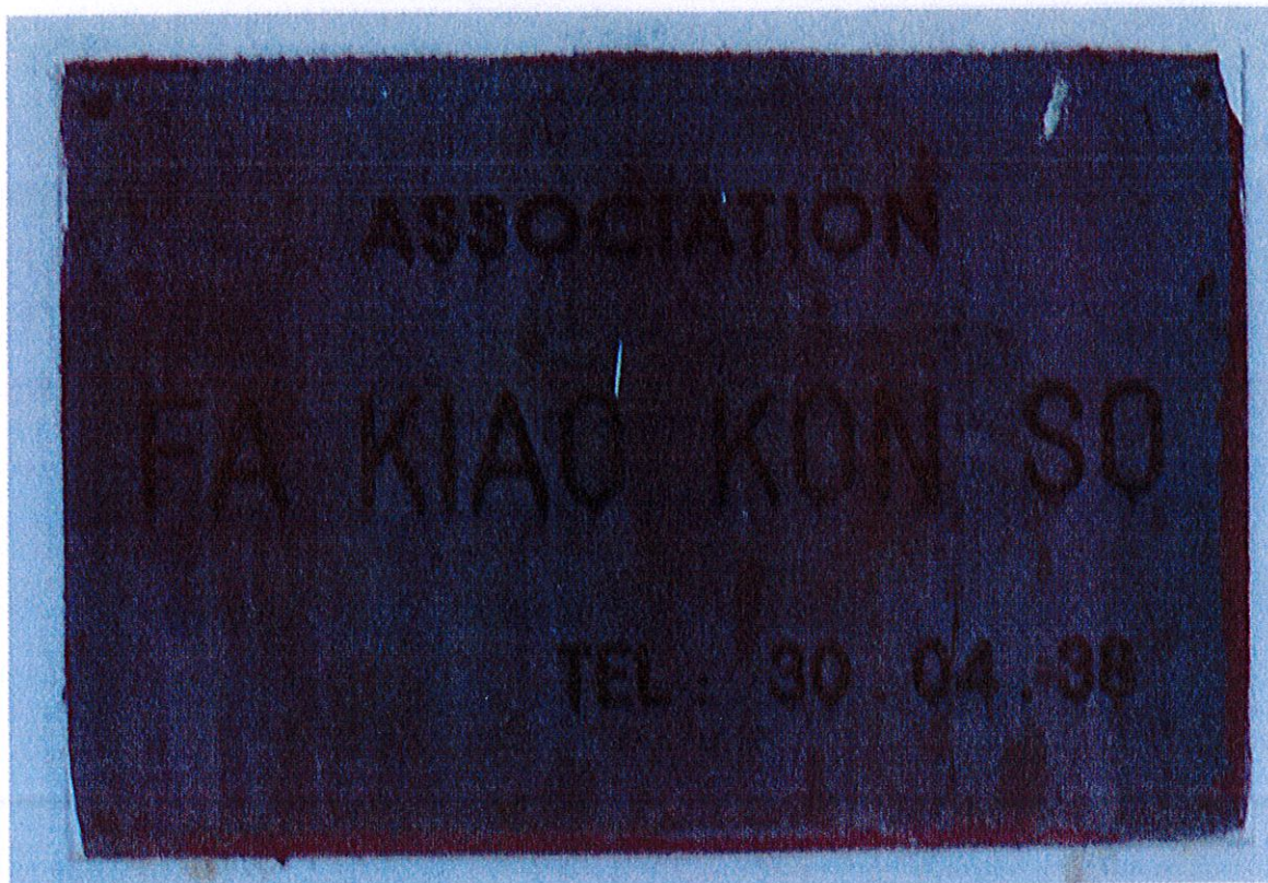
Nom de l'association Fa Kiao Kon So apposé sur le mur, Cayenne, Place des Amandiers, Dubost, décembre 2012