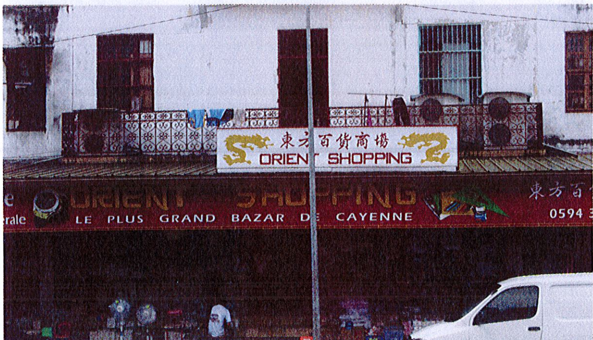
Bazar qingtian, Cayenne, place des Palmistes, Dubost, juin 2015