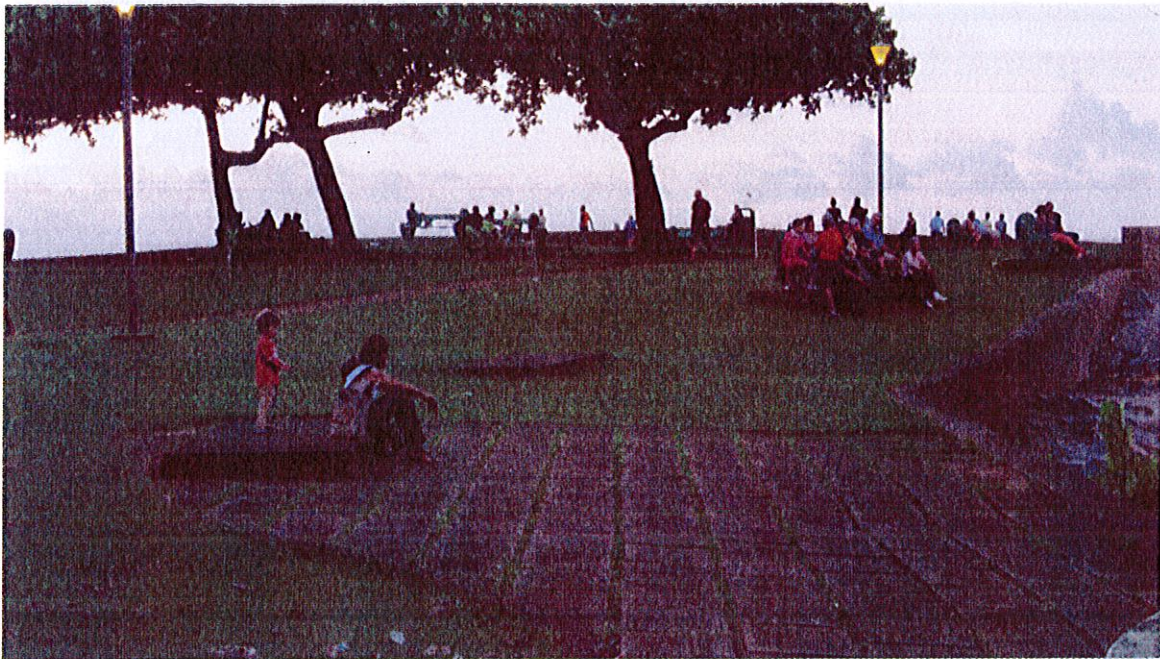
Rencontres un soir de juin, Cayenne, Pointe des Amandiers, Dubost, juin 2015