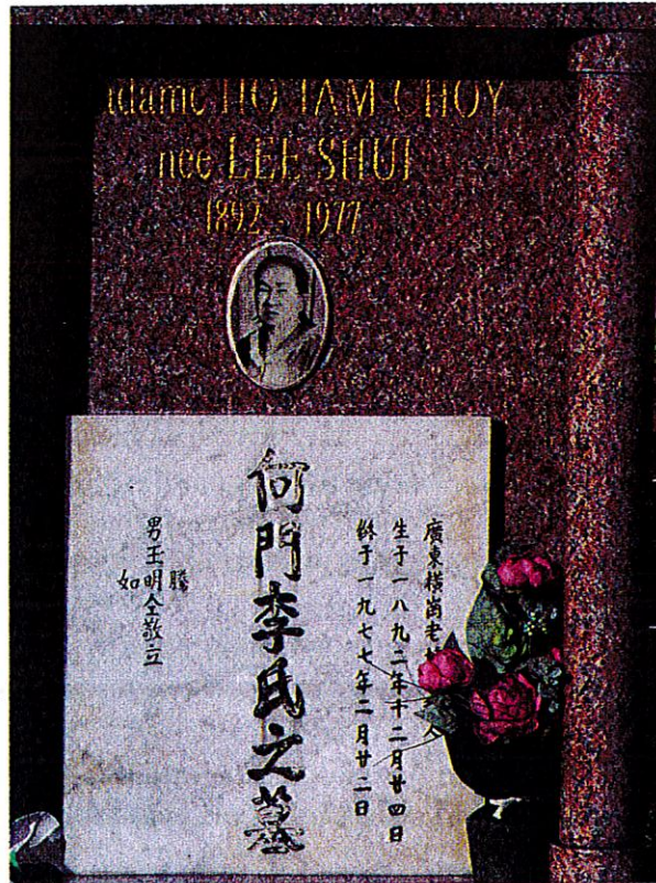
Tombe famille Ho Tam Choy, preuve de la présence ancienne chinoise, cimetière de Cayenne, Dubost, décembre 2012