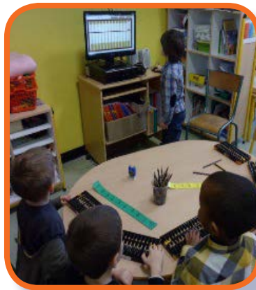
Illustration 3 : Des élèves en atelier manipulent des bouliers matériels et virtuels ainsi qu'une bande numérique

Dans une classe de GS (Grande Section), un professeur a choisi de mettre en place une séquence sur le nombre avec la manipulation du boulier chinois. Un ordinateur (qui est également celui du professeur) est disponible en classe. Lors des ateliers (environ six élèves), les élèves découvrent le boulier matériel, inscrivent et lisent des nombres. Ce professeur organise ensuite l'espace de sa classe pour qu'un groupe d'élèves puisse travailler sur une table et utiliser l'ordinateur de la classe avec le logiciel boulier. Cette organisation permet aux élèves de manipuler le boulier virtuel et ensuite de débattre des propositions de chacun. Par la suite, le boulier est intégré lors des rituels du matin (absents/présents et date) pour compléter les représentations (ou codages) du nombre présents en classe (constellations, doigts, chiffres, lettres, etc.).