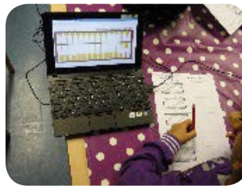
Fiches papier/crayon et boulier virtuel (en GS)