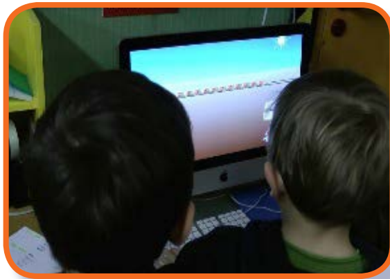
Illustration 1 : Deux élèves travaillent sur le logiciel le « Train des lapins »

Dans l'une des classes de GS (Grande Section) observée et équipée d'un seul ordinateur, le « Train des lapins » est utilisé comme exercice d'entraînement pour motiver les élèves. Des binômes d'élèves sont constitués et vont successivement travailler sur l'ordinateur de la classe. Quel dispositif a été imaginé par le professeur de cette classe ? Les élèves découvrent d'abord la situation sur le logiciel : un binôme d'élèves manipule sur l'ordinateur et les autres élèves sont des observateurs actifs (proposant des solutions en cas de blocage, commentant les actions du binôme, etc.). Plusieurs séances en atelier associant matériel tangible et travail en binôme sont menées. Le logiciel est également utilisé comme entraînement régulier pour les élèves afin de stabiliser les connaissances en cours d'acquisition sur le nombre. Alors qu'un atelier est en cours, les élèves vont par binôme s'entraîner une dizaine de minutes sur le logiciel puis réintègrent leur atelier. Le logiciel est également proposé en manipulation autonome lors de l'accueil du matin.