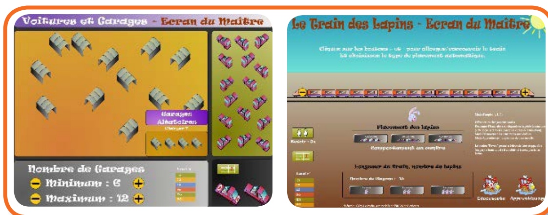
Illustrations 6 : Écrans du maître des logiciels « Voitures et garages » et « Train des lapins »

Lorsque l'on propose des ressources mathématiques pour l'école, il convient de se questionner sur ce qu'apportent ces ressources aux professeurs des écoles pour adapter leur enseignement à chacun des élèves de leur classe. Ce point est central lorsque ces ressources s'adressent à des élèves d'école maternelle car les différences entre enfants peuvent être importantes. Le nouveau programme de l'école maternelle (applicable à la rentrée 2015) souligne bien cet aspect. Pour les logiciels « Voitures et garages » et « Train des lapins », cette question de la différenciation a été prise en compte dès le processus de conception des logiciels. En effet, pour permettre aux professeurs de personnaliser le parcours des élèves sur le logiciel, des éléments du logiciel sont paramétrables par ces derniers sur l'écran du maître.