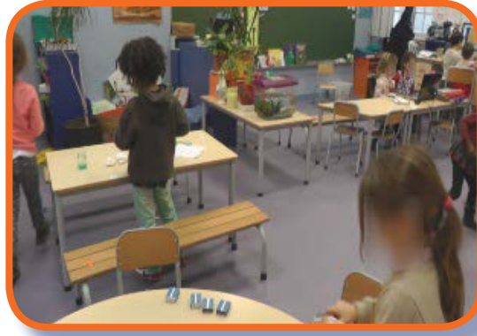
Illustration 2 : Certains élèves travaillent sur le logiciel « Voitures et garages » (fond) et d'autres avec le matériel (boîtes)