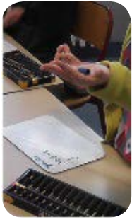
Doigts, décomposition sur ardoise et boulier matériel (en CP)