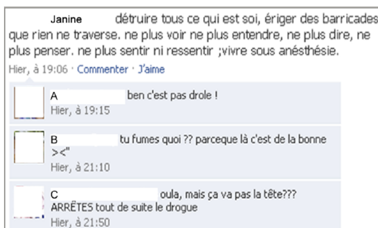
Illustration n°3 : Message publié par Janine

Ces 31 commentaires, comme les signes d'adhésion 23 , sont autant de marques de soutien. Il s'avère que 100% des sondés ont rédigé des messages déprimés, tristes, maussades, lugubres (Ill. 3). L'effet perlocutoire est sans surprise : « Quelle réaction recevez-vous de vos "amis" ? Hermione répond : La réaction attendu, tout le monde lache des commentaires de soutien. »