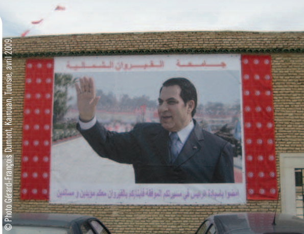
Karouan, Tunisie, avril 2009.

De l'évolution démographique de la Tunisie résulte une pyramide des âges qui montre que le début des années 2010 est marqué par les classes d'âge 20-24 ans et 25-29 ans 3 , qui forment les générations les plus nombreuses. Ces dernières se retrouvent avec un poids démographique inédit, absolu et relatif. Mais le régime ne les a pas vues venir. Il a bénéficié dans les années 2000 d'une diminution du taux de dépendance en raison des effectifs limités de personnes âgées et d'une réduction du nombre de jeunes à scolariser dans les écoles et les collèges. C'était le moment où les réformes étaient particulièrement indispensables pour répondre aux besoins et aux attentes des générations les plus nombreuses qui allaient arriver à l'âge actif.