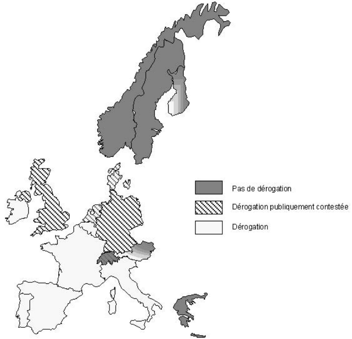
Carte 1. Dérogation à l'étourdissement pour abattage rituel. Situation en Europe occidentale (2004)

La Suède, la Norvège, l'Islande et la Suisse ainsi que 6 provinces autrichiennes n'autorisent aucune dérogation à l'étourdissement pre mortem de l'animal (zone sombre sur la carte) 4 . A l'inverse, cette dérogation est applicable en France, au Royaume-Uni, en Belgique, au Danemark 5 , en Italie, en Irlande, aux Pays-Bas, au Portugal et en Espagne (zones claire et hachurée). Les conditions de dérogation ne sont pas systématiquement