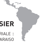
Carte n° 1 : Les aires protégées et leur date de création