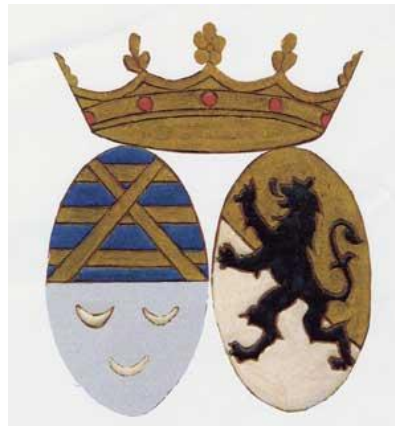
Figure 1 - Armoiries des Barons de Saint-Amand

Nous pensons avoir donné à présent suffisamment d'informations d'ordre généalogique sur les acteurs que nous allons rencontrer dans l'histoire de la forge de Montiers, qui fait suite.