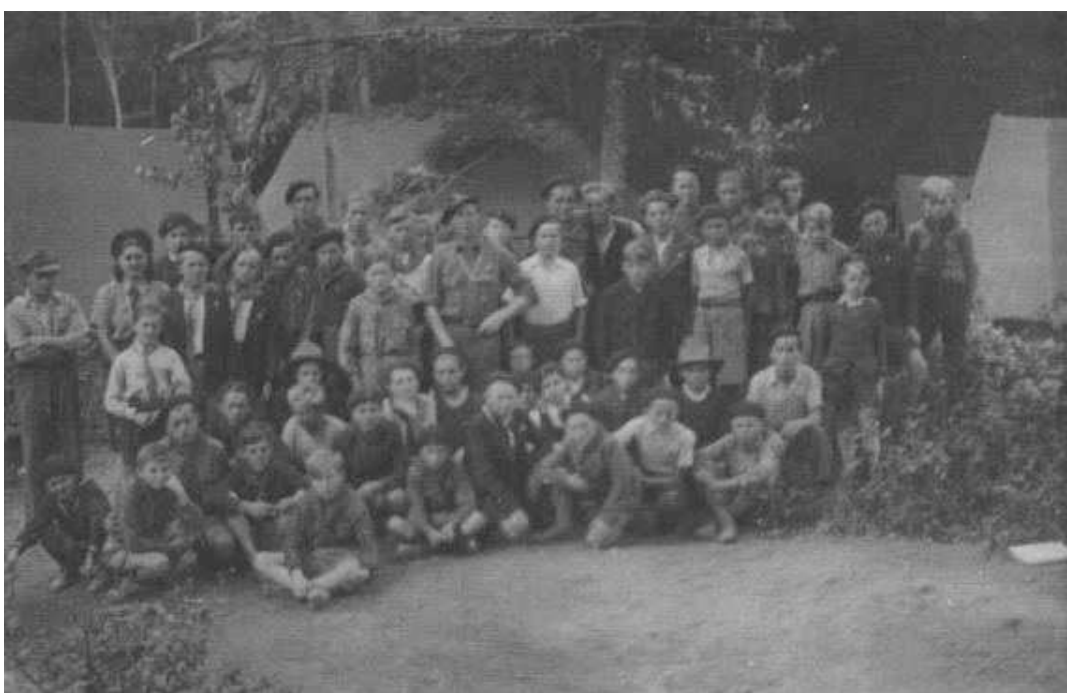
Scouts polonais de Rosières en séjour à La Rochemillay (Morvan) 1946

Le recrutement de Portugais, d'Africains du Nord, de Russes, se solde par un échec, seule la greffe polonaise prend. Il faut dire qu'une main d'oeuvre catholique et féconde abritant quelques individus vigoureux - ce sont des travailleurs de force que recherche l'usine - ne pouvait que plaire au patronnat local qui parvient à retenir, malgré la très grande volatilité de cette main d'oeuvre, quelques centaines de familles. Leurs membres trouvent là un emploi sûr, une autorité susceptible de négocier leur intégration à la société française et un environnement mi usinier mi rural moins dépaysant que la grande ville et surtout leur permettant de trouver, du fait de leurs compétences de paysans, d'indispensables compléments à des salaires qui restent maigres. Tirant le meilleur partie du lopin qui leur est alloué, ils élèvent fréquemment quelques bêtes, envoient les enfants glaner, voire s'emploient, après leur travail à l'usine, dans les fermes du voisinage. Enfin une petite Polonia se recrée à Rosières, avec ses organisations, son club polonais, fier de sa bibliothèque, un groupe de scouts, une équipe de football aussi, une école polonaise enfin, qui fonctionnera jusqu'au début des années cinquante et offre à ces familles dont la plupart entendent rentrer en Pologne, la garantie d'une éducation polonaise des enfants.