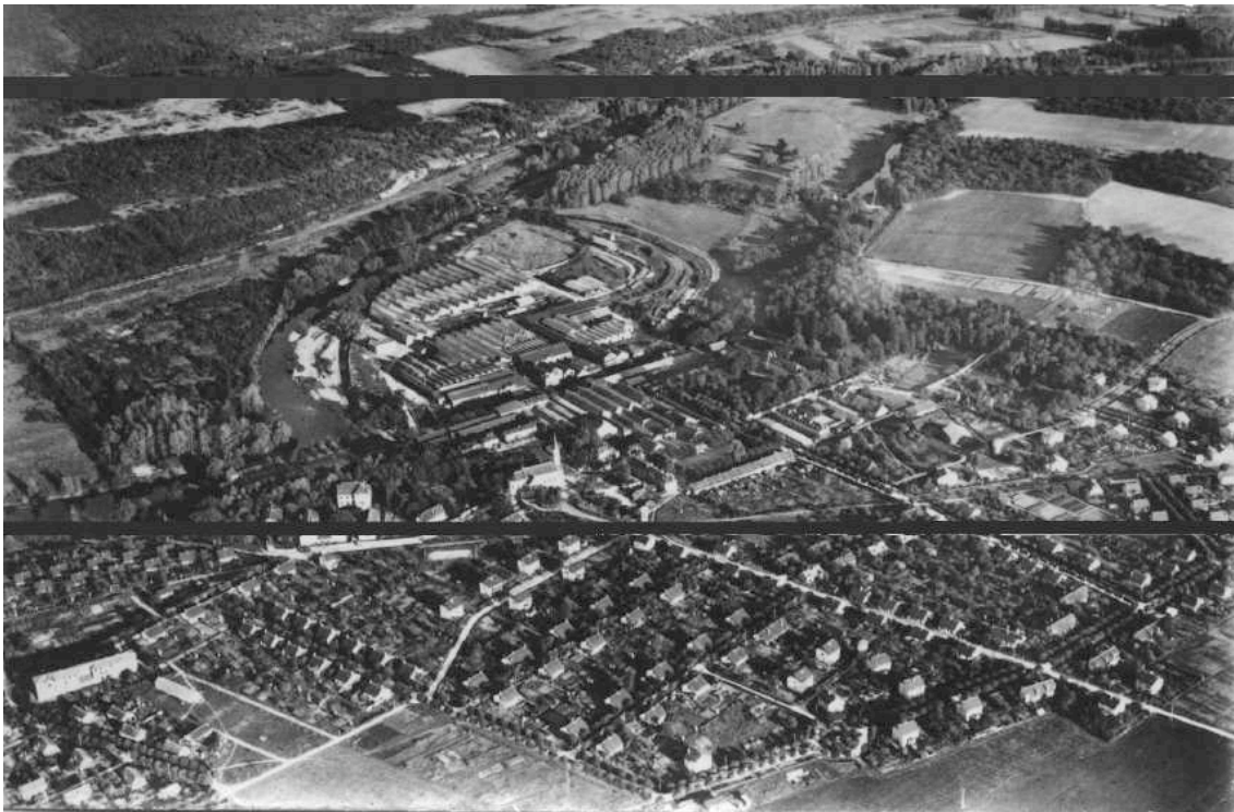
L'usine et une partie de la cité de Rosières, vue aérienne années cinquante

L'usine 4 , lovée au creux d'un boucle du Cher produit depuis le milieu du dix-neuvième siècle des articles de fonte, en particulier, à l'époque qui nous intéresse, des cuisinières, à l'aide d'une main d'oeuvre logée dans des maisons ouvrières groupées autour d'une place centrale qui fait face à l'usine. Celle-ci prend en charge les membres des familles ouvrières du berceau à la tombe. Un dispensaire, un ouvroir, une coopérative, un stade, plus tard un centre d'apprentissage, sont censés satisfaire les besoins de la population ouvrière. Revers de la médaille, celle-ci doit se soumettre aux normes et à la discipline de l'espace usinier, qui prescrit jusqu'à la participation au concours annuel du plus beau jardin, encourage les familles nombreuses et déconseille tant l'activité syndicale que l'activité politique. De plus le travail est pénible et dangereux et les salaires, au regard de ceux pratiqués dans la région, faibles. A partir du début du vingtième siècle, l'usine peine à recruter la main d'oeuvre nécessaire. La première guerre mondiale ne fait qu'aggraver ces difficultés. Aussi les dirigeants de l'usine tentent-ils à plusieurs reprises d'acclimater des populations étrangères 5 .