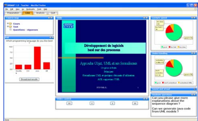
Figure 2 – Interface utilisateur de l'enseignant