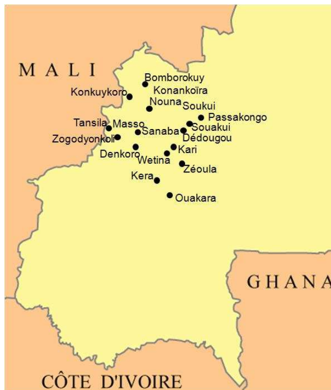
Figure 3 - Localisation des villages visités dans la Boucle du Mouhoun