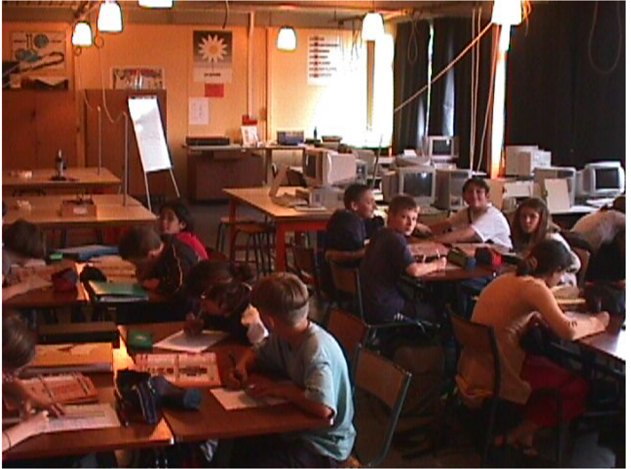
Photographie 4. - Collège : espace de groupe

Sur cette photographie prise en collège, on distingue au premier plan l'espace de groupe. C'est le lieu des regroupements, typique des moments où l'enseignant s'adresse aux élèves, conduit la structuration des connaissances, prescrit les traces des activités dans le cahier ou le classeur. Cet espace possède les attributs de la salle de classe ordinaire et habituelle d'établissement du second degré. Les espaces d'activités individuelles ou par petites équipes d'élèves (souvent en autonomie) se découvrent au second plan. La photographie 5 détaille l'un de ces espaces.