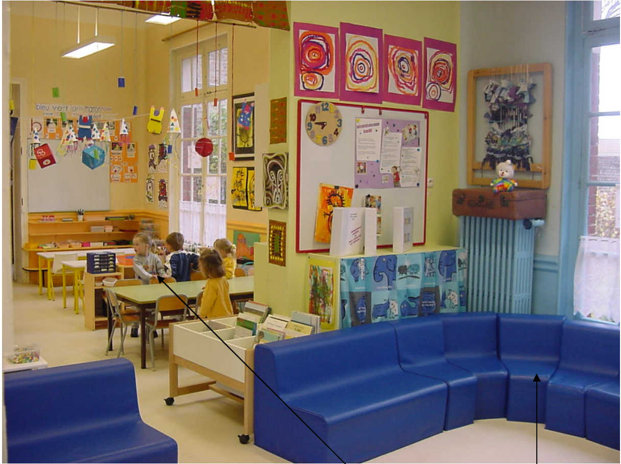
Photographie 1. - Ecole maternelle : espace de groupe et espace collectif

Dans l'espace de groupe s'effectuent souvent les rencontres avec les objets techniques. Ils sont sortis de leur rangement pour être placés sur les tables, à disposition des élèves. Les enseignantes organisent alors cet espace en « tables d'atelier » dans 90 % des cas selon notre enquête. L'espace collectif, typique de l'école maternelle, n'est pas destiné aux activités de cette nature.