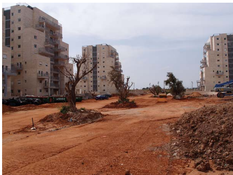
Lod, nouveau quartier vs. oliviers

Ces villes nouvelles avaient comme défi de loger les importants flux migratoires