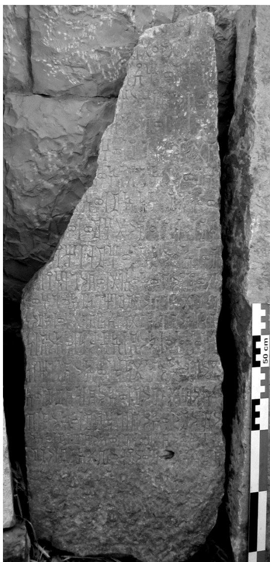
Figure 2 : Inscription Jabal Riyām 2006-17.