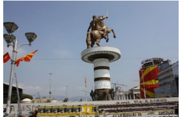
Statue d'Alexandre le Grand

Statue de Metodija Andonov Čento (premier président de l'Assemblée de l'ASNOM – Assemblée antifasciste de libération populaire de Macédoine) inaugurée sur la place centrale de Skopje le 7 juin 2010. Pour un coût d'1,1 million d'euro, la statue de marbre pèse 2,5 tonnes, mesure 5 m de hauteur auxquels s'ajoutent les 2,5 m du piédestal.