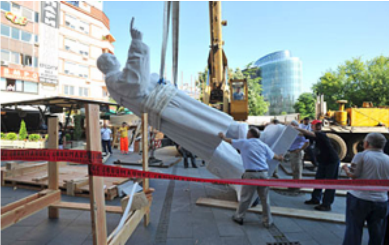
Statue de Metodija Andonov Čento

Statue de Metodija Andonov Čento (premier président de l'Assemblée de l'ASNOM – Assemblée antifasciste de libération populaire de Macédoine) inaugurée sur la place centrale de Skopje le 7 juin 2010. Pour un coût d'1,1 million d'euro, la statue de marbre pèse 2,5 tonnes, mesure 5 m de hauteur auxquels s'ajoutent les 2,5 m du piédestal.