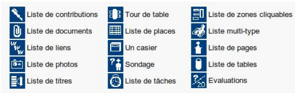
fig 3: les 15 différents types de forum

Une deuxième spécificité de notre étude, est de reposer sur un très grand nombre d'interactions menées par un très petit nombre d'étudiants. Sur Accel, 25 étudiants et 25 enseignants génèrent environ 9000 messages durant une formation de type Master1 ou Master2. Une première analyse qualitative des messages a montré que les échanges épistémiques entre pairs étaient très minoritaires, ce résultat est déjà évoqué par Celik et Mangenot [12, p 79] lors de l'analyse qualitative, sur des forums utilisés en formation, des marques énonciatives pouvant témoigner de la constitution d'une communauté d'apprentissage.