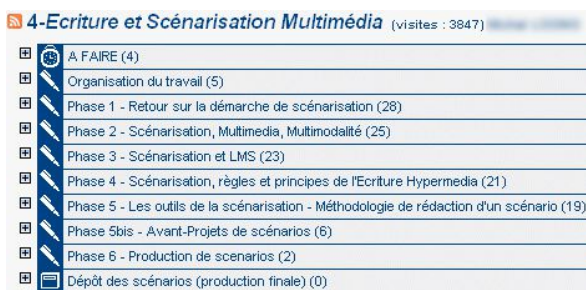
fig 2 : forme thématique

D'autre part une forme thématique, l'enseignant utilise alors la forme de l'atelier pour organiser le savoir, on trouve dans celui-ci des listes thématiques où les contributeurs sont autant l'enseignant que les étudiants : « Phase 1 retour sur la démarche de scénarisation, phase 2 etc... » cf fig 2