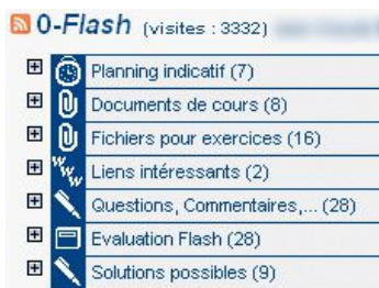
fig 1 : forme fonctionnelle

Une première étude qualitative, a permis d'exhiber deux modèles spécifiques d'ateliers [4]. D'une part des ateliers ayant une forme fonctionnelle, l'enseignant étant par l'instrumentalisation qu'il fait de l'artefact, prescriptif de la tâche et donc inducteur de l'activité : « lisez ici les cours, déposez ici vos commentaires, téléchargez dans cette liste les ressources etc... ». cf fig 1.