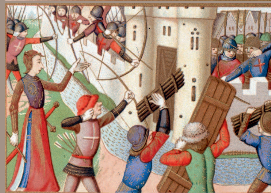
Episodes de l'histoire de Charles VII et de Jeanne d'Arc (Fac simile des miniatures des vigiles du roi Charles VII) in "Jeanne d'Arc" par H. Wallon 1876.