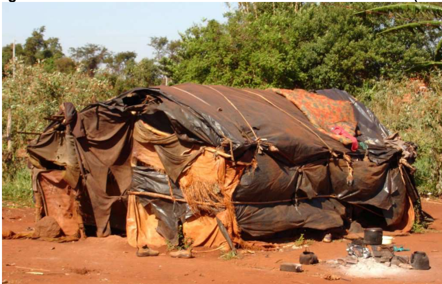
Figura 1: RID - Barraco feito de lona utilizado como moradia (2007)

Na foto, destaque para as condições de moradia de uma família indígena na RID. A destruição da natureza e o aumento populacional contribuem para a falta de materiais básicos para a construção da casa tradicional, que aos poucos vem sendo substituída por verdadeiros barracos de lonas ou por construções de alvenaria realizadas pelo poder público local, contribuindo para a perda da cultura e da identidade do grupo.