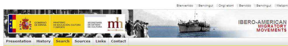
Imagen 4. El Portal de Movimientos Migratorios Iberoamericanos en inglés.

Otro de los aspectos novedosos del Portal de Movimientos Migratorios Iberoamericanos es la incorporación del multilingüismo. Tanto los contenidos, como la información contextual del Portal, están en todas las lenguas cooficiales del Estado español y en inglés (Ver Imagen 4).