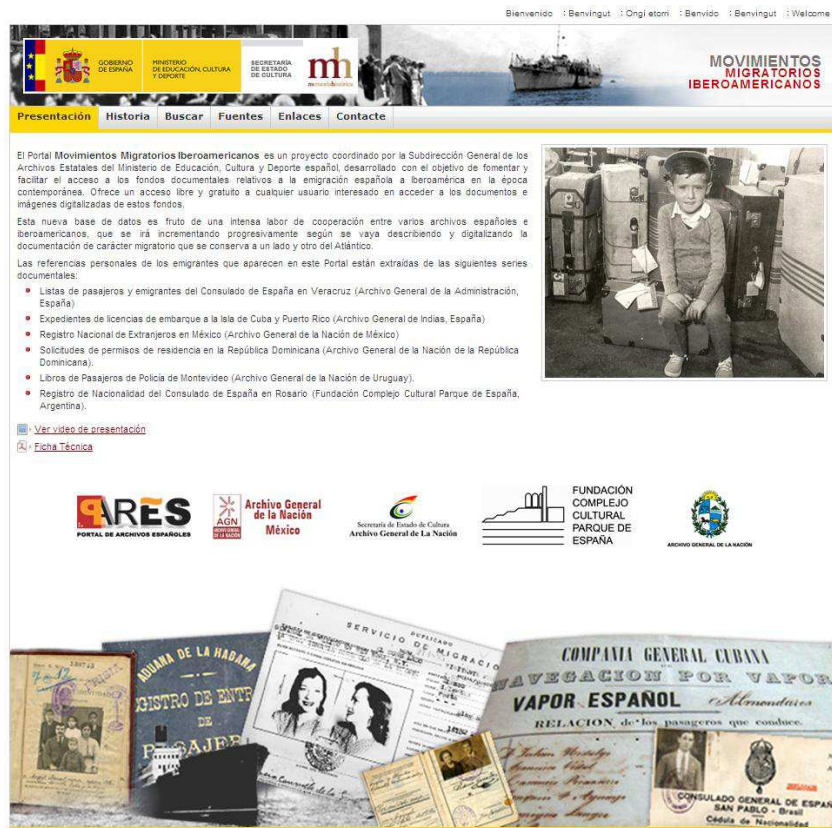
Imagen 1. Pantalla de inicio del Portal de Movimientos Migratorios Iberoamericanos.

Uno de los criterios introducidos para la búsqueda de emigrantes es el género. Filtrando por este criterio, se obtiene como resultado un total de 17.408 mujeres emigrantes en la base de datos, es decir, un 23% del total de personas que aparecen en los documentos descritos. (Ver Gráfico 1).