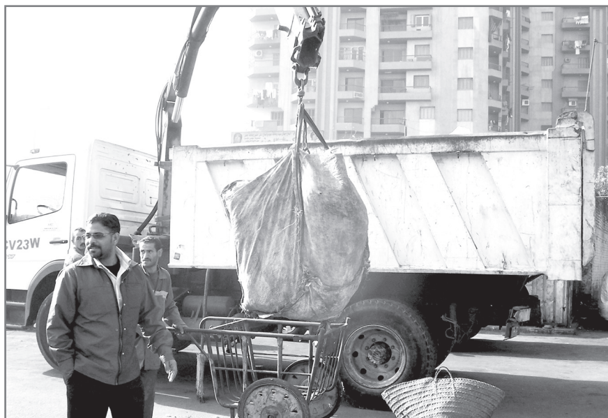
Figure 4– Équipement de l'entreprise AAEC adapté à la collecte des déchets ménagers dans les quartiers à la voirie étroite (vienne ville et quartiers informels). Auteur : Lise Debout, mars 2009.

n'ayant plus les moyens d'investir, ni même d'entretenir son matériel, le service qu'elle offre se dégrade et, en retour, la société se voit imposer des pénalités par la GCBA. Or, c'est la même agence qui est en partie responsable des retards de paiement de la société... En août 2009, IES cesse la collecte des déchets pour faire pression sur le gouvernorat... En pleine chaleur, les ordures s'accumulent dans les rues : l'entreprise s'est finalement vu accorder une aide financière par le ministère de l'Environnement. Cette nouvelle « crise » est amplement diffusée par les journaux et est l'occasion de faire ressurgir les débats nationalistes : « Ni espagnole, ni italienne, la solution est dans une entreprise égyptienne! » (Debout, 2007 et 2009). Les entreprises EES et IES n'ont pas négocié avec les zabbâlîn des petits quartiers qui, moins organisés et bien moins équipés en matériel que ceux de Manchiat Nasser, n'ont pas eu voix au chapitre. En conséquence, elles se trouvent dans une situation plus opaque et ne parviennent à rendre un service complet, notamment dans certains quartiers pauvres.