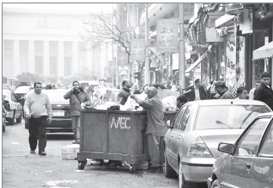
Figure 2– Une rue du centre-ville. Deux chiffonniers (l'un à l'extérieur de la benne, l'autre debout à l'intérieur en retrait du premier) cherchent des cartons ou des plastiques. La benne appartient à l'entreprise AAEC. Auteur : Pascal Garret, février 2010.

leurs territoires professionnels, les parcours varient en fonction du danger. Les façons de faire sont inégales et différencient ceux qui possèdent un pick-up , de ceux qui utilisent une charrette tirée par un âne ou de ceux qui sont à pied et qui sont dans une position encore plus vulnérable. De même, certains d'entre eux ont conclu des accords avec les commerçants ou avec les concierges d'immeubles qui gardent pour eux les déchets ; mais ces procédés ne concernent pas tous les zabbâln , loin s'en faut. A Manchiat Nasser, d'après l'un des responsables associatif, environ un quart des zabbâln – estimation difficile à vérifier – aurait totalement cessé le porte-à-porte et, sans territoire de collecte particulier, ramasserait dans la rue, dans les bennes et auprès des commerçants, exclusivement le carton et le plastique destinés au recyclage (entretien auprès du président de l'Association des collecteurs de déchets entretien, Manchiat Nasser, février 2010, BF).