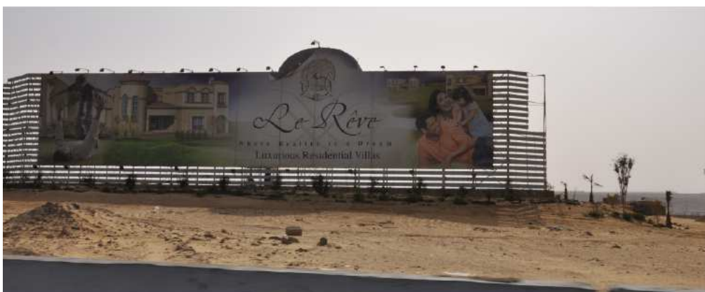
Figure 14. Panneau publicitaire pour le compound Le Rêve - New Cairo