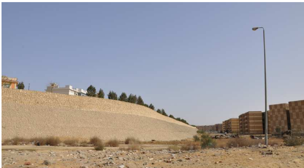
Figure 16. Le mur du luxueux compound Kattameya Heights surplombant les immeubles de la promotion publique New Cairo