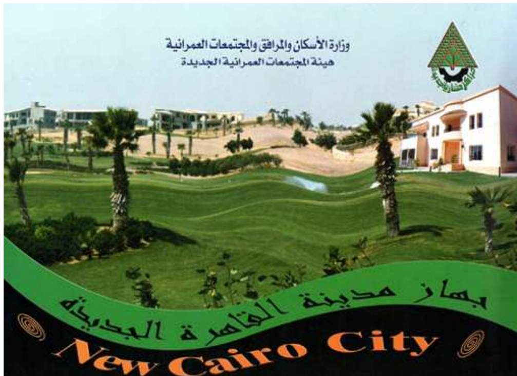
Figure 3. Dessins de villas présentées dans la brochure officielle de New Cairo.

Ministère de l'Habitat, des Services et des Villes nouvelles.