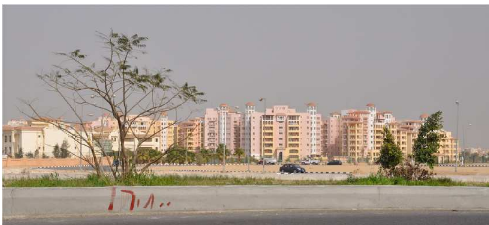
Figure 8. Complexe de logements de Dreamland , vue de l'extérieur