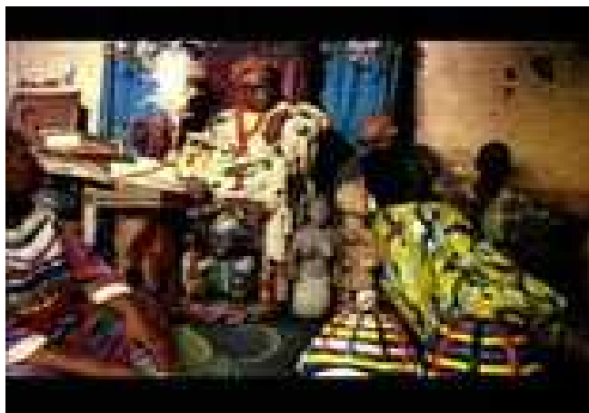
Figura 2. Filme Pierre Verger de Lula Burque de Holanda, Brasil, 2009

El documental brasileño “Pierre Verger: Mensageiro de Dois Mundos” de Lula Buarque de Holanda (2009) trata de la trayectoria de Pierre Verger como etnógrafo de diferentes culturas: la francesa, la brasileña y la Africana. La escena seleccionada capta la visita de Gilberto Gil a una autoridad política en un territorio que era frecuentado por Pierre Verger y alude a la construcción de jerarquías entre culturas.