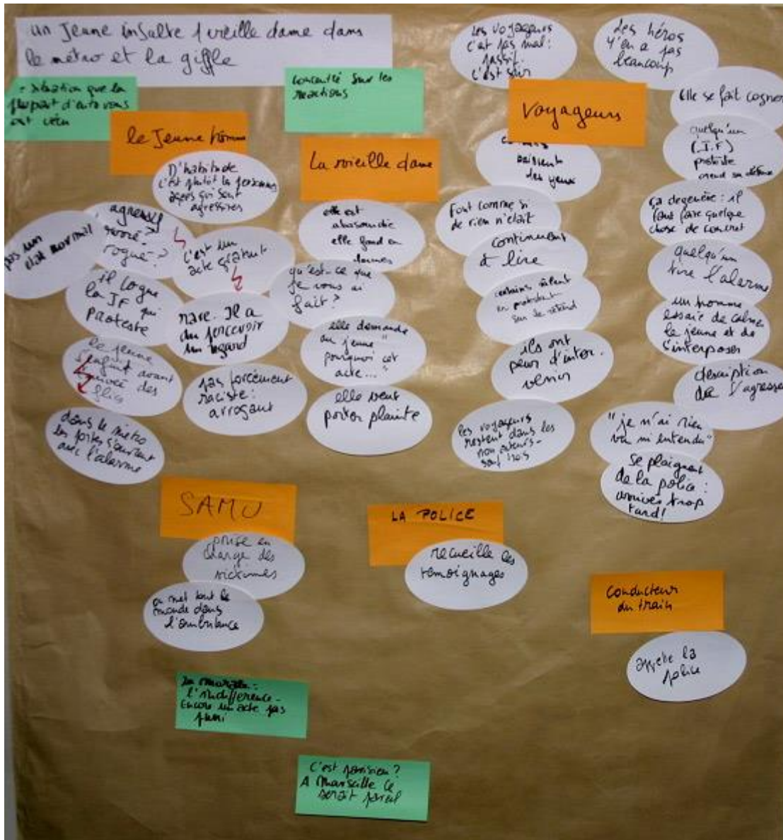
3/ Groupe des employés