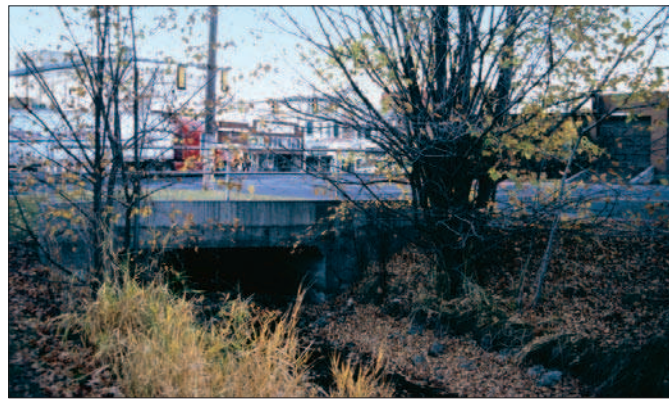
FIGURES 7 et 8.

Entrance of downtown Logan with hidden canal. Utah.