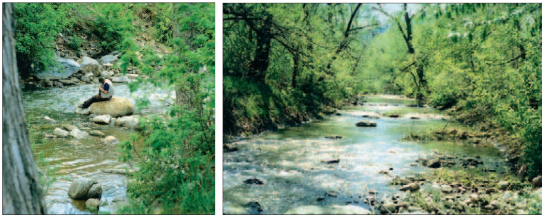
FIGURES 14 et 15.

La restauration de Boulder Creek, dans le Colorado pourrait être utilisée comme un exemple du continuum de l'eau de l'espace naturel aux milieux urbains et comment le dessin-bien que non utilisé pour ce projet-pourrait servir l'analyse et les procédures d'évaluation, ainsi qu'aider à communiquer des idées pour les aménagements paysagers proposés. L'endroit (voir les figures 14 et 15) montre que le continuum de l'eau dans les lieux urbains n'a pas besoin d'avoir des caractéristiques naturelles pour être réussi, mais qu'il doit continuer d'offrir des habitats pour les truites, de la végétation pour les rives et leur stabilisation. Les solutions préconisées améliorent la circulation de l'eau et traitent sa relation à la ville; elles enrichissent la qualité de vie de ses habitants et des visiteurs.