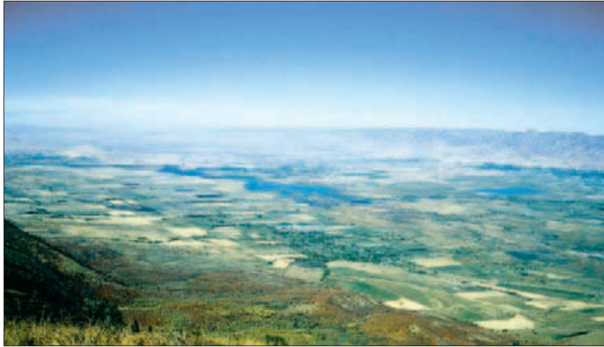
FIGURE 4. Disturbance of the water continuum at different scales