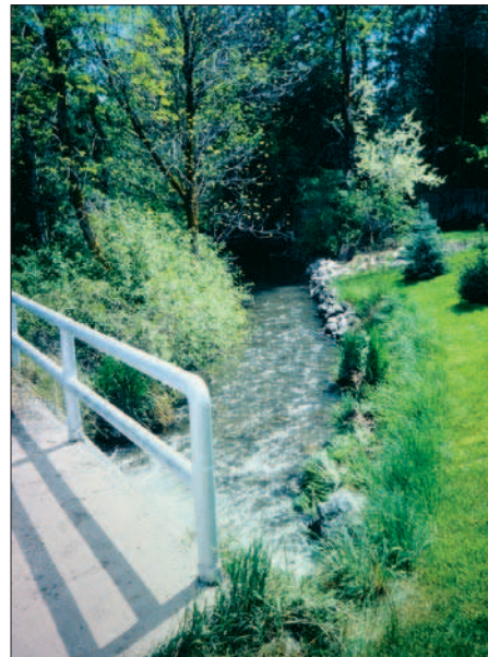
FIGURE 5. Disturbance of the water continuum at different scales