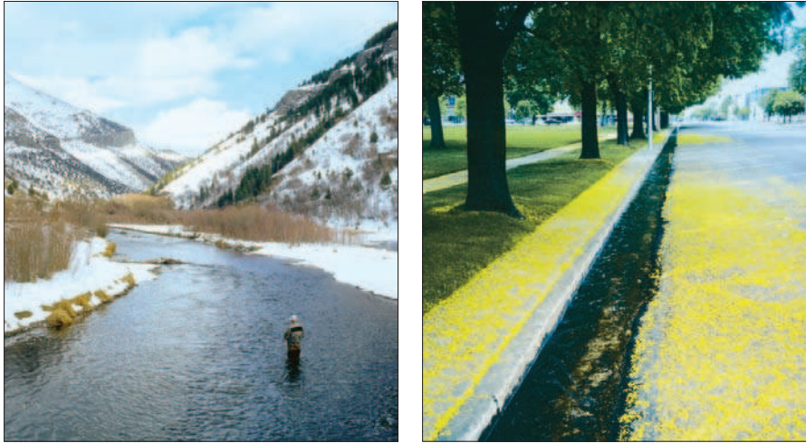
FIGURES 1 et 2.

The Logan River, canal in residential area, and a street ditch. Logan Utah.