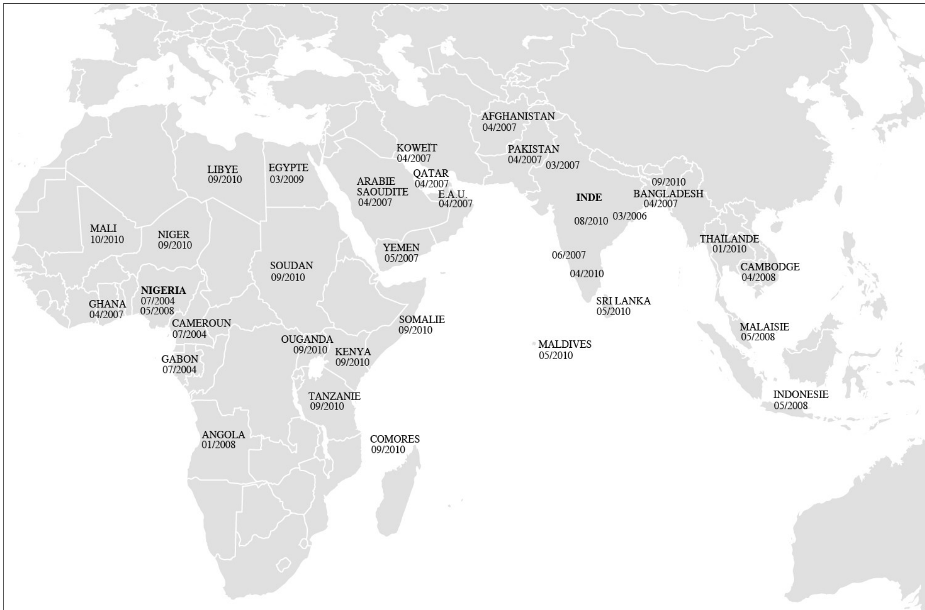
Carte 1. Diffusion de la rumeur des numéros tueurs (2004-2010)