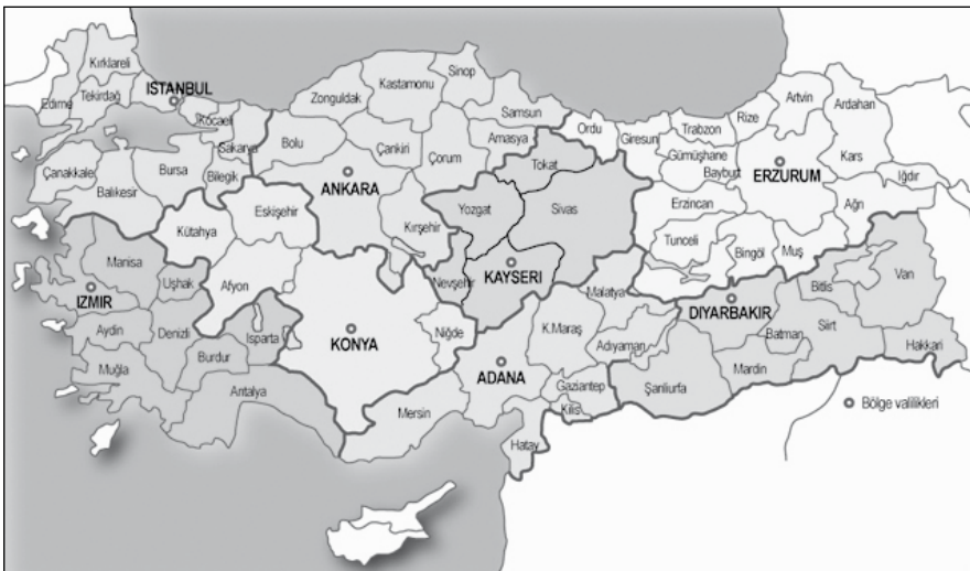
Carte 1 Les huit régions et leurs préfetures proposées par le général Evren