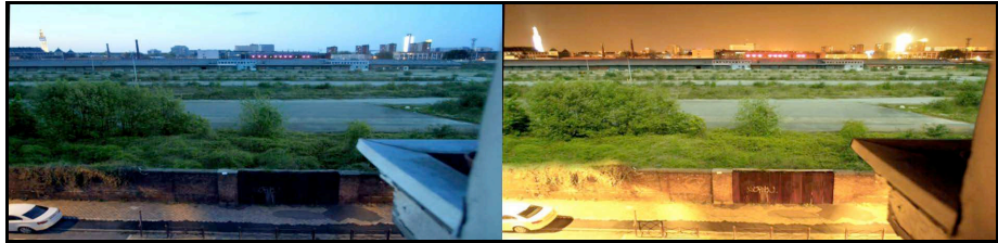
Figure 4 : Deux vidéogrammes de la vidéo Nycthéral