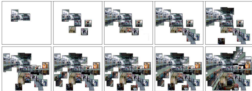
Figure 1. Vidéogrammes de la vidéo Santo Domingo n° 863

Ce qui se joue ici c'est le rapport entre la configuration spatiale du lieu et les actions sociales qui s'y déroulent. Le choix d'un point de vue panoramique permet de restituer l'ensemble de l'espace en question. Le fait de multiplier les moments de prise de vue permet d'interroger la récurrence de chacune des actions relevées en fonction de l'endroit où elles se réalisent. Le fait d'isoler par un système de cache chacune de ces actions permet alors de les identifier, de les classifier et d'en dresser une typologie. Ces actions s'apparentent en réalité à ce que l'on appelle dans le domaine des ambiances urbaines et architecturales des figures , c'est-à-dire « la façon pour le lieu de s'incarner dans un personnage » (Amphoux, 2001 : 163). Dans la vidéo présentée ici nous pouvons retrouver une série de figures de parcours identifiées par Jean-Paul Thibaud dans sa recherche sur la place de la Convention à Paris : celle du pivot du trajet , du territoire de l'attente , du pause en pause ou de la curiosité en passant (Thibaud, 2007 : 210). Ce procédé offre alors deux avantages : d'abord de renforcer le caractère immuable de l'architecture, un mur reste un mur quel que soit le moment de la journée ou de la semaine, ensuite de révéler les différents types de figures que cette architecture peut engendrer, en interrogeant leur récurrence et leur régularité à différents