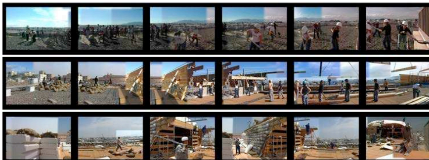
Figure 2. Vidéogrammes de la vidéo Trincheras (détail sur trois séquences)