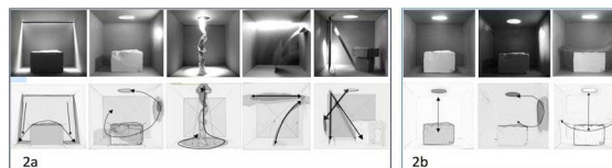
Figure 2. Ex. analyse spatiale; principaux éléments d'attention visuelle

La mise en commun de quelques analyses spatiales souligne dans une certaine hiérarchie, le sens de lecture potentiel ou estimé entre les éléments visuels dominants (figure 2a). La représentation graphique à l'aide de flèches marque le parcours du regard. Elle synthétise les actions concertées ou non des éléments présents. La force de certaines images est principalement due au renforcement mutuel entre lumière et objets, lorsque ceux-ci concordent formellement. La lumière exerce une grande importance sur l'attention visuelle. La modification de son intensité ou de l'angle d'éclairage, par exemple, transforme complètement la lecture des volumes. La figure 2b montre des ambiances lumineuses évoquant une certaine dématérialisation visuelle de l'objet par la lumière pour une organisation spatiale constante.