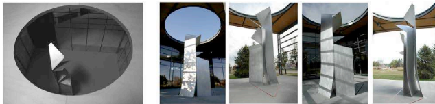
Figure 3. Le fil, 2008, Karole Biron, Œuvre d'intégration à l'architecture, Bibliothèque Félix Leclerc, Québec