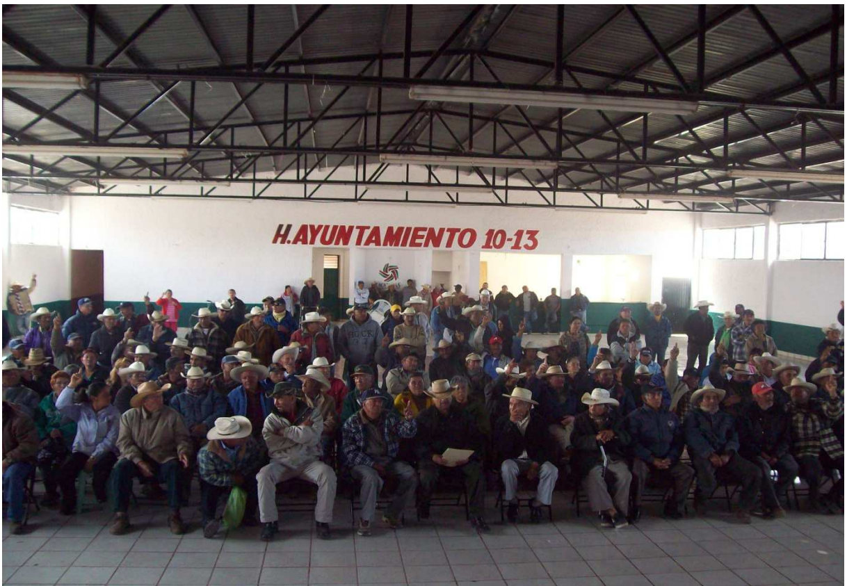
Assemblée régionale de l'association civile Ex Braceros en Lucha A. C. , commune de Noria de Ángeles, Zacatecas, 24 février 2012.

Carlos Fuentes, La plus limpide región , 1956.