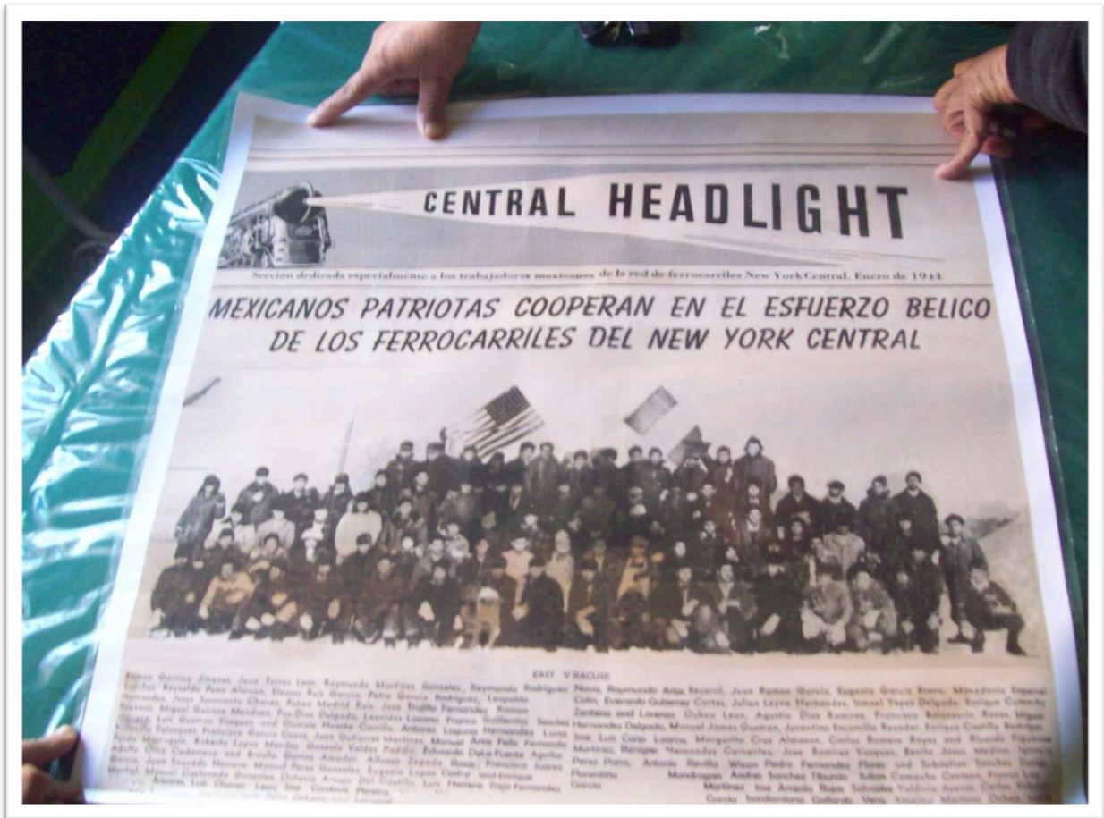
Photo d'un groupe de braceros employés dans les chemins de fer nord-américain publiée dans un journal américain en janvier 1944 en langue espagnole. Ce document fut présenté aux autorités en charge du dossier indemnisation par un bracero (le sixième accroupi sur la première ligne en partant de la gauche) pour attester sa qualité d'ancien travailleur des chemins de fer, dans le cadre des accords braceros. Sans succès.

Archive de l'association Ex Braceros en Lucha A.C, photo de Ph. Schaffhauser, prise le 25 février 2012.