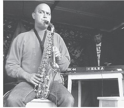
à gauche: Section harmonique d'une fanfare.