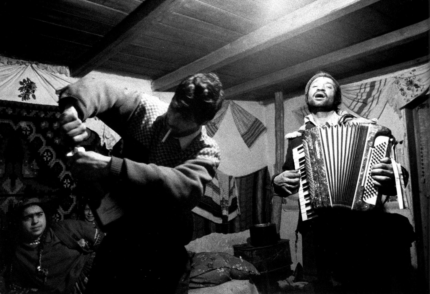
Fig. 6 The Midnight Meal. «Romas Caldarari», Bacau, Roumanie, 31 décembre 1999 © Yves Leresche.

En Roumanie, les musiciens professionnels tendent à associer « vol » et « imagination » comme deux principes complémentaires de la créativité. Ils n'ignorent pas l'existence d'un système de droits d'auteur, national et international, et ne rechignent bien sûr pas à toucher les éventuels dividendes de leur production artistique. Ils ne cherchent pas pour autant à restreindre l'accès à leurs « œuvres » car leur modèle économique est fondé sur la performance musicale. La notion même d'œuvre ne fait pas vraiment sens bien que, par ailleurs, des mélodies jugées « nouvelles » apparaissent régulièrement. L'idée que les droits d'auteur protégeraient ou encourageraient la création artistique se voit plutôt contredite, dans leurs discours comme dans leur pratique. Le fait qu'ils intègrent toujours davantage le marché du disque et les réseaux du spectacle vivant international ne semble pas modifier leur façon de voir. Pourront-ils maintenir ce point de vue ? Il est difficile de le prévoir, mais leur longue tradition professionnelle, bien plus ancienne que leur rencontre avec les principes de « propriété intellectuelle », semble les inciter à croire qu'on peut fort bien se passer de droits d'auteur et vivre, néanmoins, de la musique.