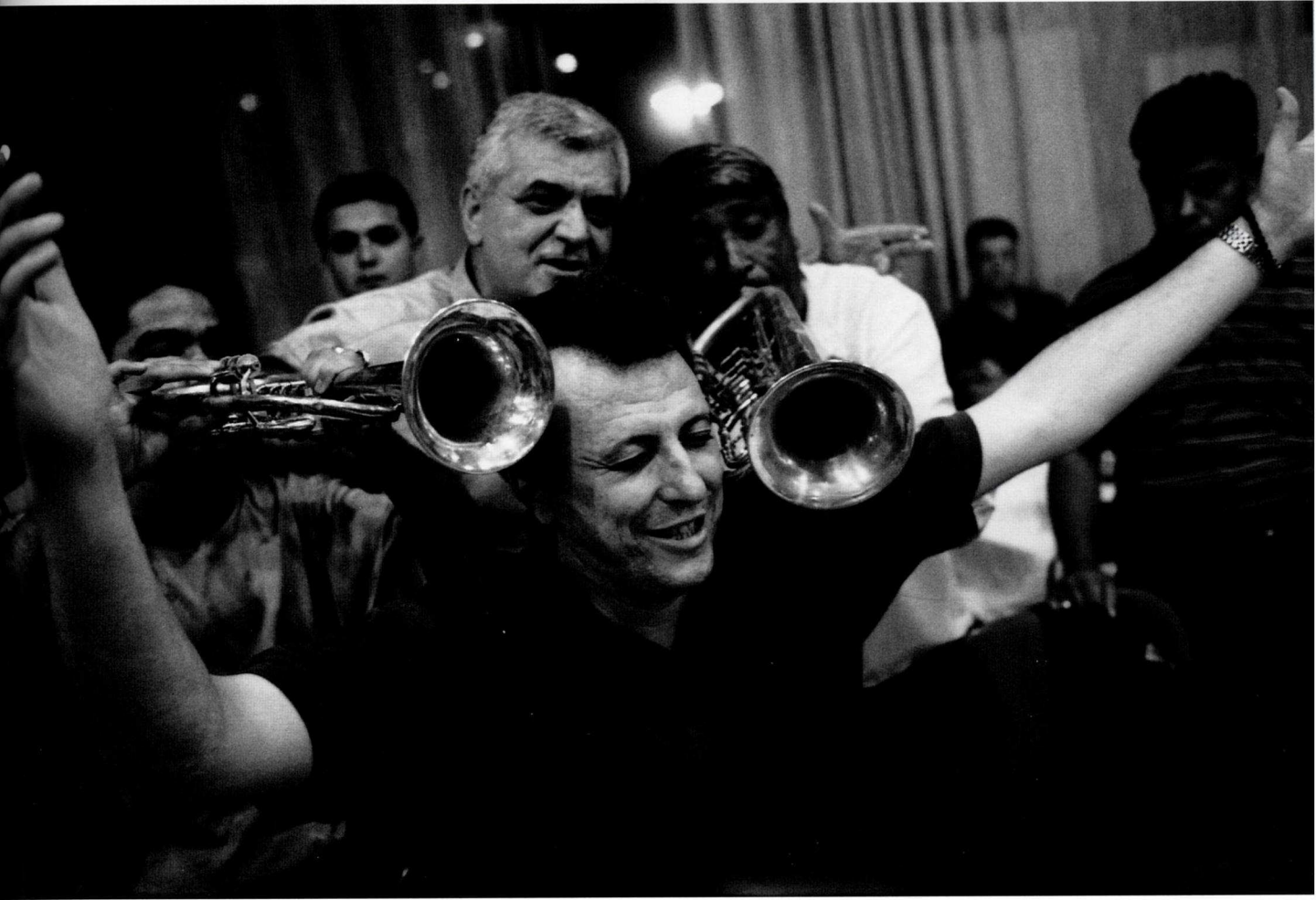
Fig. 5 Fête après le concours-sélection des fanfares de la région de Vranje, hôtel Serbia, Surdulica, sud de la Serbie, 13 juillet 2002 © Pablo Fernandez / Bsidés.fr.

rement à un ou plusieurs des acteurs énumérés précédemment, et il ne peut être utilisé sans leur accord pour une création nouvelle. Mais, en commentant des cas similaires d'enrichissement, Georgel et les autres lăutari parviennent à des conclusions différentes. Dans leur analyse, le succès d'un musicien est lié en premier lieu à une intelligence des opportunités. La chance est aussi un facteur reconnu. Certains « spéculent » ( speculează ) sur des idées qui étaient accessibles à tout le monde, mais que personne n'avait su, auparavant, faire fructifier. Que peut-on leur reprocher ? Dans cette combinaison de liberté créative et de libéralisme économique, le seul problème serait que les musiciens qui signent les morceaux à succès ne donnent pas, sur leurs propres créations, les droits mêmes qu'ils se sont arrogés en reprenant les morceaux « traditionnels ». En pratique, c'est bien ce qui se passe : par exemple, la Sweet Lullaby enregistrée par Deep Forest est protégée par le copyright, comme l'était en principe le chant d'Afunakwa, mais avec en plus toute la puissance juridique de Sony Music. C'est là, plus que dans le partage des revenus, que l'inégalité pourrait devenir immorale aux yeux des lăutari . Or, pour le moment, ces derniers ne font que sourire à l'idée que de telles restrictions d'usage pourraient, un jour, les concerner.