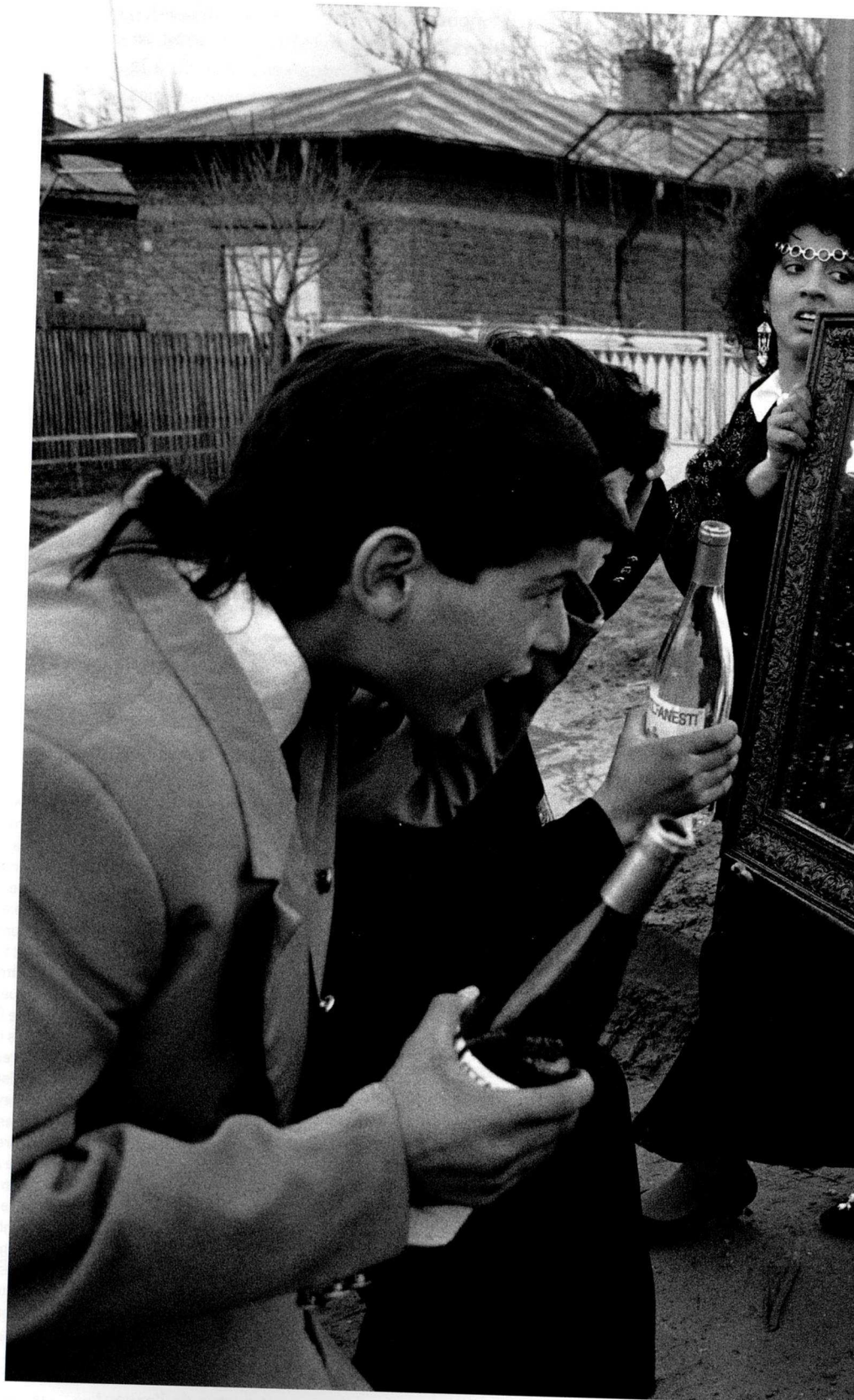
Fig. 2 Sur le chemin de l'église lors d'un mariage, Bucarest / Ilfov / Roumanie, 1995 © Yves Leresche.