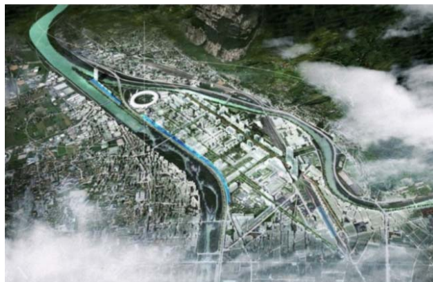
Modélisation du projet Presqu'île par le cabinet d'architecture Claude Vasconi.