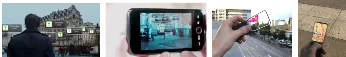
Concepts de « réalité augmentée » expérimentés au sein du « MINATEC IDEAs Laboratory ». Exemples des concepts « LOUN 2007 » et « ICI INFO 2009 ».

concepts de « réalité augmentée », permettant de superposer un monde virtuel à notre perception de la réalité (amélioration dans l'accès des citoyens à des services urbains divers).