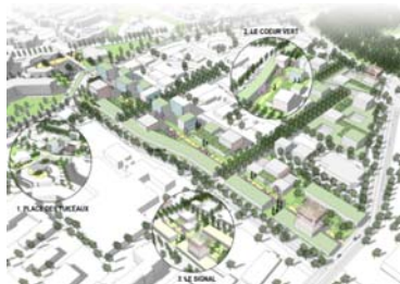
Etude pré-opérationnelle pour la requalification d'Inovalée (Meylan). INterland, 2011.