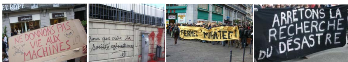
Les manifestations à l'encontre de MINATEC lors de son inauguration : « Ne donnons pas vie aux machines » ; « Pour que crève la société cybernétique » ; « Fermez Minatec » ; « Arrêtons la recherche du désastre »

Outre les risques de conflits générés par l'aggravation de la ségrégation socio-spatiale, la ville de Grenoble doit également gérer un scepticisme croissant de la société locale vis-à-vis des effets réels ou supposés des innovations technologiques 35 . La population locale de plus en plus informée, semble manifester « une aversion montante à l'endroit des risques, principalement ceux qui menacent la santé » (Filion, 2006). C'est le cas notamment de la stratégie des nanotechnologies et de l'implantation de MINATEC, qui sans véritable consultation démocratique préalable ont généré des manifestations violentes lors de son inauguration. Au niveau de Grenoble, ce débat est porté surtout par le « mouvement des simples Citoyens » qui s'opposent à la stratégie de spécialisation territoriale dans les nanotechnologies (Ferguene, 2008, p.20).