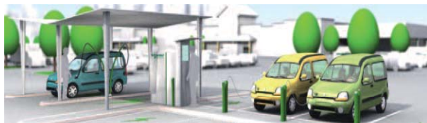
Les projets ELLISUP et Schneider Electric : développement d'infrastructures de recharge pour véhicules électriques. Images extraites des Lettres d'information du projet GIANT.

Citons également l'action pilote, déposée auprès de l'ADEME, sur les réseaux intelligents («smart grids»), visant à offrir des solutions concrètes de maîtrise énergétique auprès des consommateurs, ainsi que le programme européen d'innovation collaboratif, HOMES. Piloté par Schneider Electric, ce programme regroupe treize partenaires, industriels et acteurs de recherche, qui conçoivent des solutions pour optimiser les usages et diversifier les sources d'énergie dans les bâtiments tertiaires et résidentiels.