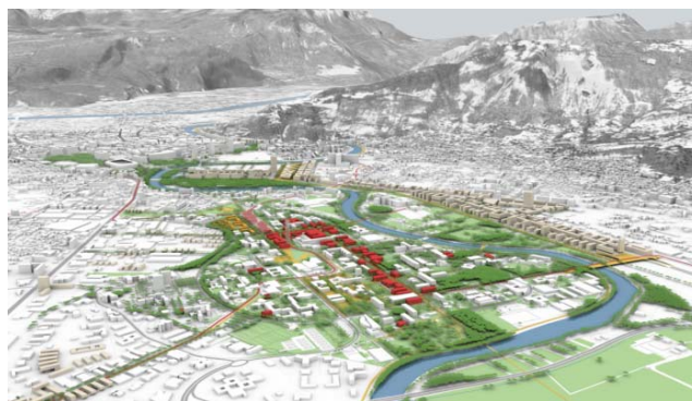
Schéma d'aménagement et de développement du campus universitaire. INterland, 2008.