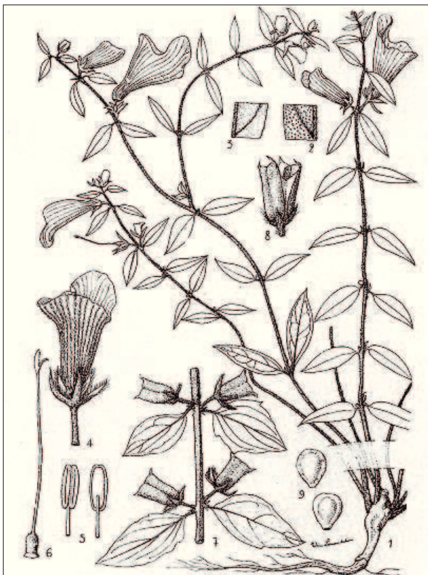
FIG. 154. — Ceratotheca sesamoides Endl.

1. Aspect général, réduit aux 2/3. — 2. Détail du limbe, face sup., \times 2 . — 3. Détail du limbe, face inf., \times 2 . — 4. Fleur, gr. nat. — 5. Anthère \times 4 , sur deux faces. — 6. Pistil \times 2 . — 7. Rameau fructifère réduit aux 2/3. — 8. Fruit ouvert, gr. nat. — 9. Graines \times 4 .