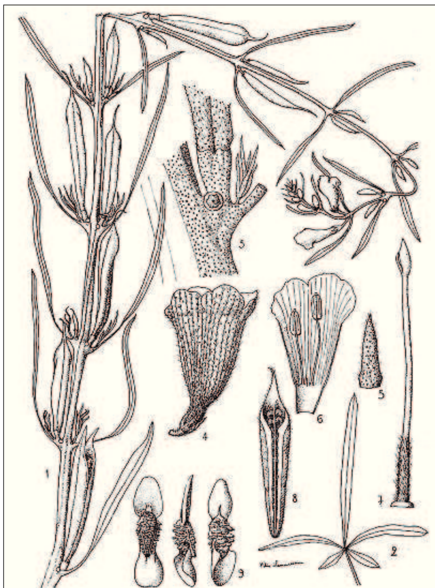
FIG. 155. — Sesamum alatum Thonn.

1. Rameau fleuri et fructifère réduit aux 2/3. — 2. Feuille réduite aux 2/3. — 3. Mode d'insertion de la feuille et du fruit. — 4. Fleur \times 2 . — 5. Sépale \times 6 . — 6. Partie de la corolle, face interne, et étamines \times 2 . — 7. Pistil \times 4 . — 8. Coupe du fruit, gr. nat. — 9. Graine \times 4 , sur trois faces.