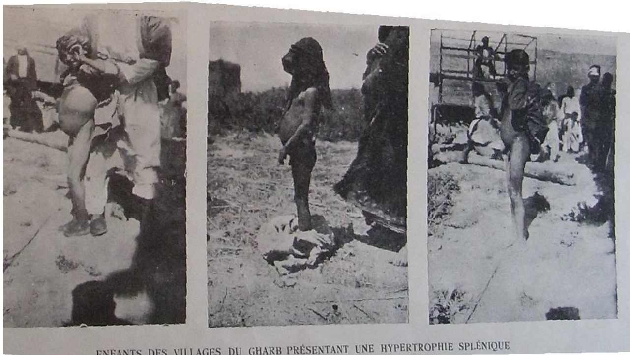
Figure 1 : Images d'enfants syriens présentant une splénomégalie, vraisemblablement liée au paludisme.

C'est à partir de la connaissance de ce cycle que les malariologues cherchent les moyens d'identifier les cas, et d'agréger ces identifications pour produire une mesure de prévalence. Il n'en existe pourtant pas en valeur absolue (MAXCY & COOGLE 1923b : 2467), car la maladie reste présente chez des porteurs asymptomatiques humains (VON EZDORF 1916 : 819) et, pour la forme tierce bénigne, est susceptible de récurrences, parfois tout au long de la vie. Les malariologues disposent cependant de plusieurs indicateurs présumés corrélés à la prévalence.