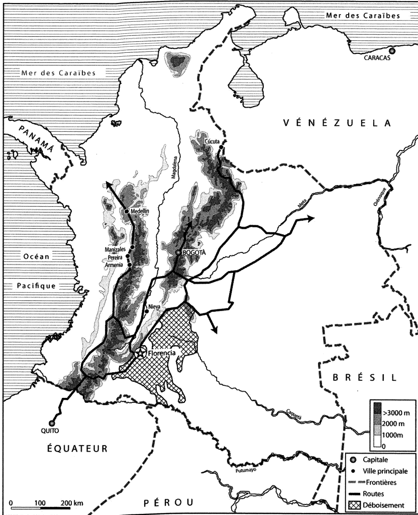
Figure 1 - Localisation de la zone d'étude