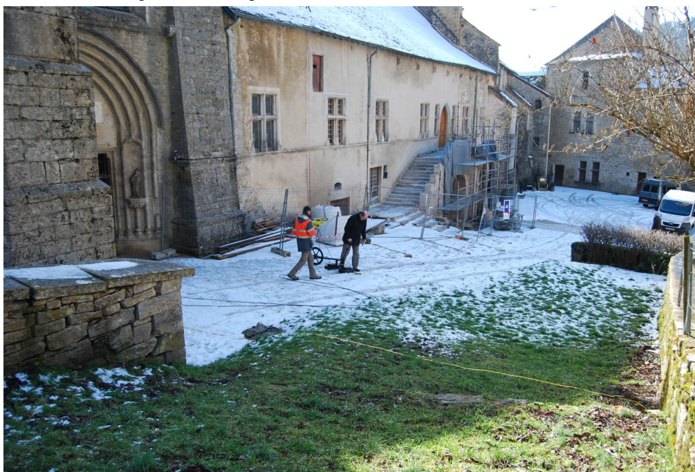
Fig. 1 - Baume, prospection géophysique sur le parvis de l'ancienne abbatale.