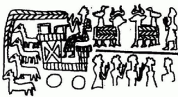
Sceau utilisé par Walawala

Une enveloppe intacte d'une créance porte quatre scellements. Le quatrième provient d'un sceau-cachet en forme de bouton à quatre trous ; il aurait été apposé par la débitrice, Ninni, qui a emprunté à un Assyrien 21 sacs de blé et 20 sacs d'orge, à rembourser au moment de la moisson 36 .