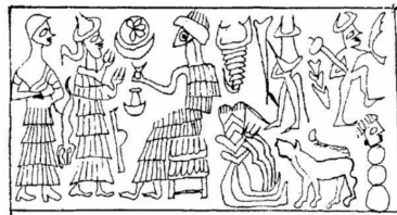
Sceau de Waqqurtum

Le sceau de Waqqurtum est également connu, il se trouve sur la moitié d'une enveloppe de lettre expédiée à Puzur-Aššur ; la lettre elle-même a disparu 30 . Ce même sceau figure sur une enveloppe fragmentaire sur laquelle on peut lire deux noms propres partiellement détruits, mais pas Waqqurtum 31 . De style paléo-assyrien, il présente un adorant devant un dieu.