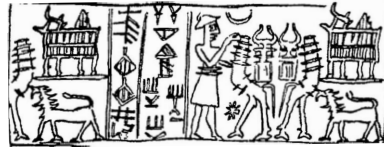
Sceau utilisé par Šatahšušar