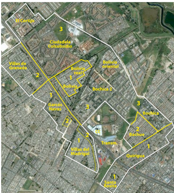
Figure 1 – Limites de la zone d'enquête Calle 80 et des strates

Réalisation : F. Dureau, sur image Google Earth