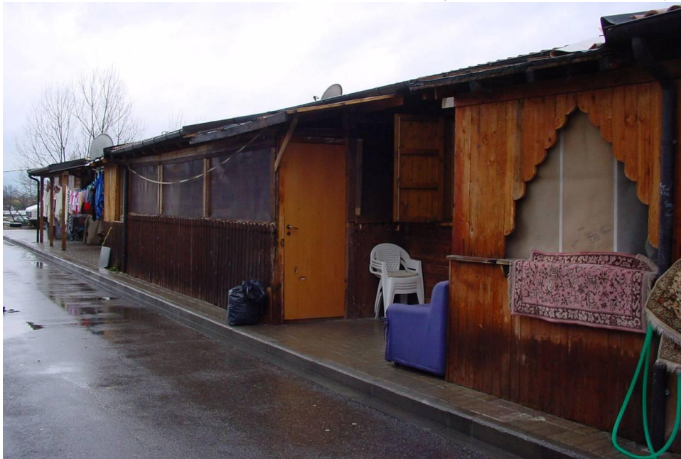
Photo 2 : Maison en bois du Nuovo Poderaccio (cliché D.F. février 2010) :

source : Google Earth – cliché 7 sept. 2007 – copie juin 2009