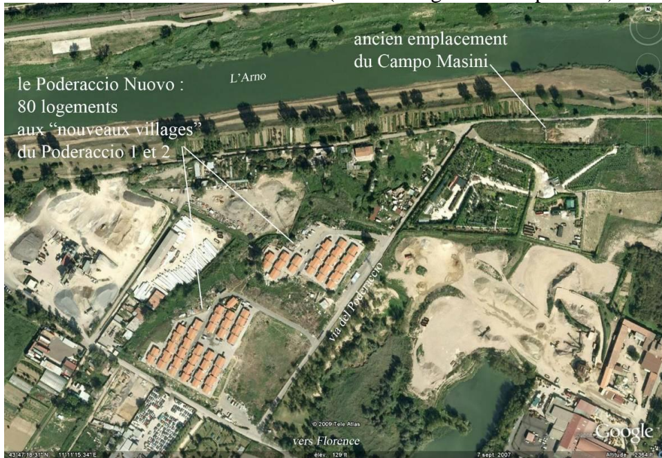
Photo 1 : Site du Nuovo Poderaccio (cliché Google Earth sept. 2007) :

source : Google Earth – cliché 7 sept. 2007 – copie juin 2009