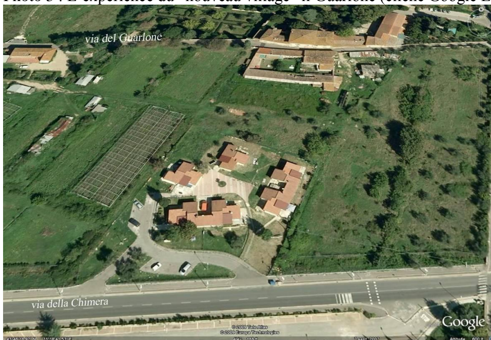
Photo 3 : L'expérience du "nouveau village" il Guarlone :