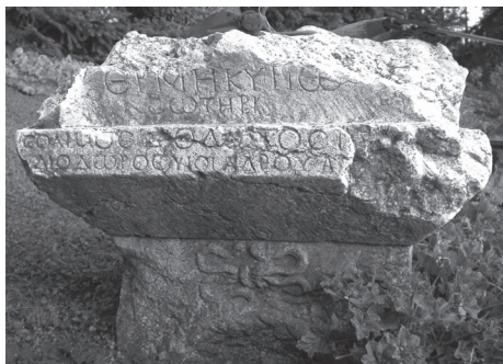
Fig. 8 – Dédicace à Hermès sur un autel du sanctuaire de Cheikh Abdallah à Baalbek. Collection privée à Beit Méry (Liban). Photo J. Aliquot (avril 2008).

familles en vue à Béryte et à Baalbek, celles des Afideni 32 , des Statilii (ou Statii 33 ) et des Tittii 34 , soit de fidèles au statut plus modeste ( Fig. 8 ) 35 .