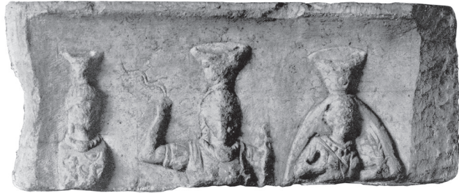
Fig. 6 – Bas-relief héliopolitain de Rome, Antiquarium du Palatin. Photo Triade 1-2 , n° 293, pl. 114.

héliopolitaine, en particulier lorsqu'ils présentent des traits originaux 23 . Sur le bas-relief de Fneidiq (Liban-Nord), par exemple, la hiérarchie habituellement respectée dans l'iconographie héliopolitaine est renversée. On y trouve un groupe identique à celui de Baalbek, mais Mercure occupe le centre de la composition (Fig. 5), contrairement à ce que l'on voit sur les rares monuments qui réunissent les dieux héliopolitains, avec Jupiter au milieu, Vénus à gauche et Mercure à droite, conformément aux règles de préséance de la tradition romaine (Fig. 6). Comme le note H. Seyrig, cet écart rappelle l'usage, notamment suivi dans le culte de Hiéropolis, de placer une enseigne sacrée portative entre Hadad et Atargatis (le σημήϊον du De Dea Syria 33) 24 . Le sanctuaire éventuellement associé au monument de Fneidiq est situé dans la haute vallée du Nahr Abou Moussa. Entre la côte et la Békaa, la région appartient à l'arrière-pays d'Arca et d'Orthosie, qui puisent elles aussi dans le répertoire iconographique héliopolitain pour représenter leurs dieux. Les populations du littoral et de la montagne vénèrent ainsi des dieux formellement comparables à ceux de Baalbek.