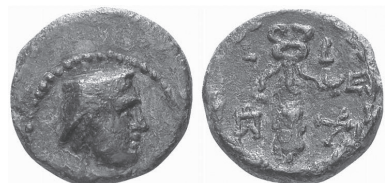
Fig. 12 – Monnaie de bronze de Ptolémaïos de Chalcis : au droit, tête d’Hermès casqué ; au revers, caducée, monogrammes du dynaste et date (ἔτους β´ = 63/62 av. J.C.). Collection J.-P. Righetti, exemplaire publié le 10 octobre 2006 sur le site CoinArchives.com, semblable à D. HERMAN, Israel Numismatic Research 1 (2006), p. 62, n° 6, pl. 7.

dieu pâtre assimilé à Hermès que se forment les légendes qui, dès l’époque hellénistique, font de la Békaa et de l’Antiliban une petite Arcadie aux marges de Béryte, Damas et Césarée-Panéas 43 . Sous Auguste, des Romains sont lotis dans la Békaa. S’ils adoptent le culte local en identifiant Hermès à Mercure, ils peuvent invoquer Mercure pour des raisons qui leur sont propres : les Romains choisissent volontiers Mercure comme l’équivalent de dieux qui leur paraissent étranges 44 .