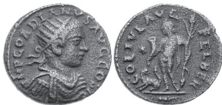
Fig. 14 – Monnaie de bronze de Béryte (239-241) : au droit, buste de Gordien III à droite ; au revers, Bacchus debout, imberbe, appuyé sur le thyrses et abreuvant sa panthère de vin. Collection privée, exemplaire publié sur le site WildWinds.com, semblable à G.F. HILL, A Catalogue of Coins in the British Museum. Phoenicia , Londres (1910), p. 89, n° 245.

de Bacchos » ; et chez cet auteur qui consacre trois chants de ses Dionysiaques aux traditions locales, Bacchus est le second grand dieu de la cité 48 . D'autres monuments invitent à partager l'enthousiasme du poète : Bacchus figure au revers des monnaies de Béryte, peut-être déjà sous Hadrien, sûrement sous son aspect juvénile sous Gordien III (Fig. 14) 49 ; une inscription lacunaire commémore l'érection de sa statue en ville, en le nommant Liber Pater en latin 50 ; Leucothéa, la nourrice du dieu, est elle aussi invoquée en latin à Béryte, à la suite de la triade