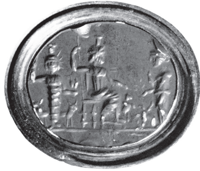
Fig. 13 – Intaille de jaspe rouge, British Museum : Jupiter héliopolitain engaîné et radié, à gauche de Sérapis trônant et de Némésis debout.

En ce qui concerne Bacchus, il semble probable que ce dieu soit accueilli à Baalbek comme à Béryte. Plusieurs témoignages illustrent la floraison de son culte à Béryte. Dans l'hymne où il énumère les divinités poliades (Hermès, Aphrodite et son cortège, Artémis, les Néréides, Zeus, Arès, les Grâces, la nymphe Béroé), Nonnos de Panopolis désigne la ville comme le « délicieux séjour