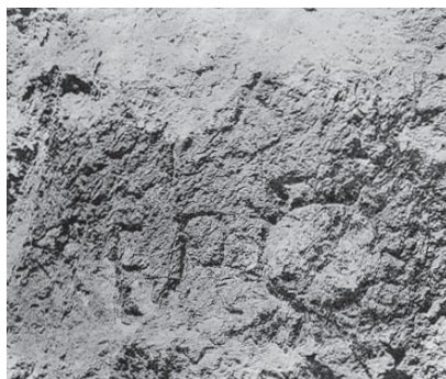
Fig. 11 – Marque MER et disque radié, sur le Jabal Terbol. Photo IGLS 6, 2977, pl. 52.