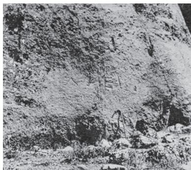
Fig. 10 – « Signe de Mercure » et marque MER , dans la carrière proche du temple romain de Nébi Chit. Photo IGLS 6, 2972A, pl. 52.