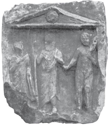
Fig. 15 – Monument funéraire de Baalbek, avec Hermès psychopompe.

Dieu du passage, Hermès escorte enfin les Syriens sur le chemin des enfers. Les monuments qui le présentent dans un contexte funèbre sont nombreux