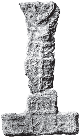
Fig. 1 – Plomb votif d'Ain el-Jouj, Staatliche Museen de Berlin.