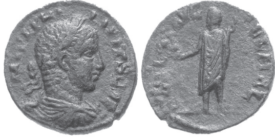
Fig. 2 – Monnaie de bronze d'Héliopolis : au droit, buste de Philippe, le fils de Philippe l'Arabe (244-249) ; au revers, Mercure debout de face, vêtu de la chlamyde, la tête de profil à gauche, la bourse à la main et le caducée sur l'épaule. Collection B. Peus, exemplaire publié le 28 avril 2004 sur le site CoinArchives.com, semblable à Triade 1-2, n° 94.

dieu en ce qu'il est flanqué de béliers et non de taureaux 8 . Il reste le protecteur des bergers et le passeur, même sur les monnaies d'Héliopolis, qui adoptent l'imagerie hermaïque grecque et romaine en le figurant la tête ailée, avec la bourse et le caducée, sans accorder aucune place au coq (Fig. 2) 9 . Enfin, bien qu'il soit la dernière divinité de la triade, Mercure porte le titre de dominus , à Baalbek comme à Béryte 10 , et reçoit même les attributs de la puissance cosmique sur l'autel inscrit de Btédaai : sur la face antérieure, il se drape dans un manteau et tient le caducée ; sur les faces latérales, le couple du Soleil et de la Lune le caractérise comme un dieu au pouvoir universel (Fig. 3) 11 .