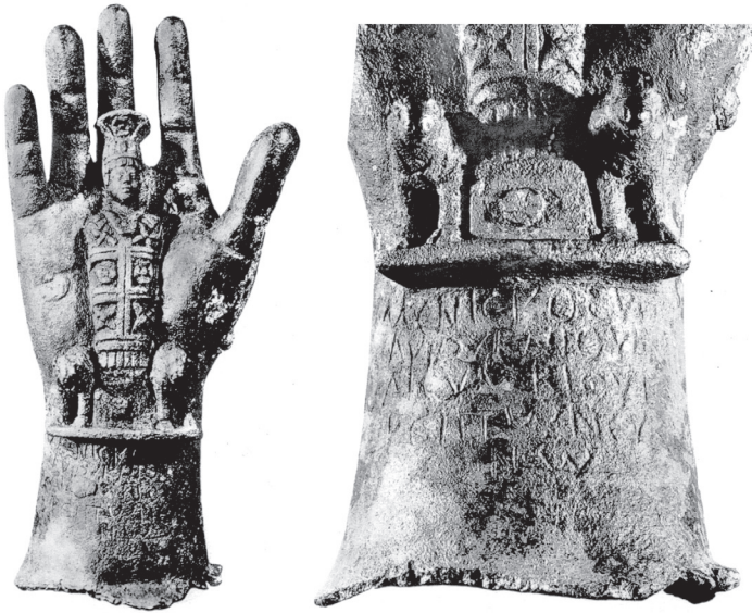
Fig. 7 – Main votive « de Niha », Musée du Louvre. Photo IGLS 6, 2930, pl. 47.

le texte qui commémore la construction de son temple en 172/3 25 ; ce n'est sans doute pas un hasard si le nom d'homme Μερκούριος rencontre un petit succès près de Ham, dans la Békaa et en Abilène 26 . À Niha, les grands dieux Hadaranès et Atargatis, qui conservent des noms sémitiques, sont peut-être accompagnés d'un jeune parèdre semblable au Mercure héliopolitain. Placé dans la paume d'une main divine en bronze passant pour provenir de ce site, ce dernier prend la forme du terme, debout, de face, cuirassé sur un socle et flanqué de béliers : le visage imberbe, coiffé du calathos , paré d'un collier, il est enserré dans une gaine décorée de motifs stellaires et solaires, de croix et de rosaces ; comme son homologue de Baalbek, il apparaît en position d'hypostase et de messager de la divinité suprême (Fig. 7) 27 . D'après les exemples cités, la romanisation des cultes passe soit par