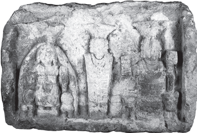
Fig. 5. – Bas relief de Fneidiq, Musée national de Beyrouth.

Le Mercure héliopolitain est donc un dieu original et distinct de Sol et de Bacchus. Il en va de même de ses alter ego libanais, qui lui ressemblent sans que l’on connaisse leur nom et qui n’appartiennent pas forcément à la triade