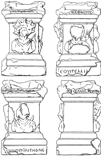
Fig. 3 – Autel de Btédaai, Musée national de Beyrouth. Facsimilé C. de la Chaussée, dans H. SEYRIG, BMB 1 (1937), p. 93, fig. 4 ( Scripta varia , p. 82).