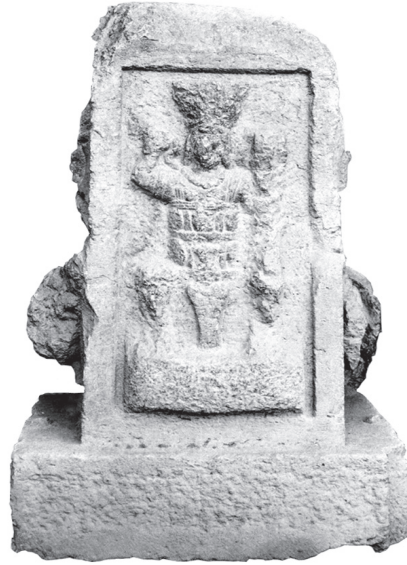
Fig. 4 – Monolithe d'Ain el-Jouj.

Le Mercure héliopolitain n'est jamais confondu avec Sol ou Bacchus. Sol n'est qu'un motif sur la gaine du dieu, comme sur celle de Jupiter 12 . Les médaillons de bronze de la Békaa, dont H. Seyrig a fait grand cas, associent bien Jupiter et Vénus à un buste solaire, mais non de manière systématique, tout comme les ex-voto d'Ain el-Jouj, qui présentent un assortiment de dieux et de héros 13 . Les monnaies d'Héliopolis où Y. Hajjar a cru reconnaître un Mercure solaire portent