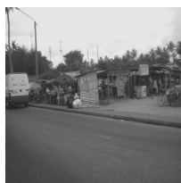
Photo : marché du fret, situé juste en face de l'aérogare fret (Cliché, Meh Anastasie, 21/04/2010)

L'effervescence commerciale observée au sein de la frontière-aéroport affecte en premier lieu les alentours de l'aéroport qui bénéficient d'une rente de situation de l'entremêlement de plusieurs frontières sur cet espace réduit. Ce pourtour aéroportuaire est en contact de plusieurs zones monétaires grâce aux liaisons aériennes directes ou non avec des pays de l'ensemble du globe et la Côte d'Ivoire. A l'image des frontières terrestres, le bouillonnement d'activités commerciales a comme incidence spatiale, l'apparition ou le développement de marché de proximité (voir photo 3).