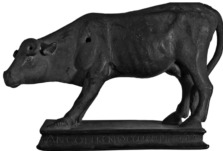
Figure 2 : Ex-voto de Bloudan (Damascène) au Musée national de Damas.