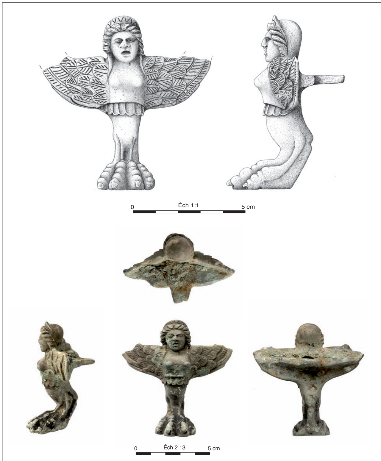
Pl. 1. Dessin (J. Gelot, INRAP) et clichés (A. Mailler, Bibracte) de la sphinge découverte à Fragnes.

Une statuette en bronze découverte à Pompéi, représentant la déesse Fortune assise, offre un intéressant parallèle (pl. 2, n° 2). Elle a les pieds qui reposent sur un petit marchepied dont les supports sont des sphinges. Un pied en forme de sphinge,