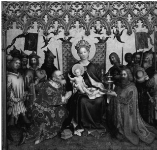
1. Stefan Lochner, Dombild ou Retable de l'adoration des mages (cathédrale de Cologne).

d'ailleurs à l'origine d'un débat célèbre et déjà ancien sur l'identité de Stefan Lochner qu'illustre parfaitement la confrontation des positions de Julien Chapuis et Brigitte Corley : faut-il identifier l'auteur du retable de l'Adoration des mages (le Dombild , fig. 1), réalisé pour la Ratskapell de la ville et conservé à la cathédrale de Cologne depuis 1908, avec le " Maister Steffan zu Cöln " que Dürer admire au point de payer deux pfennigs d'argent pour faire ouvrir son retable lors de son passage dans la ville en 1520 ? Et faut-il également reconnaître, dans ce « maître Stefan », l'une des rares personnalités documentées pour la période, le peintre Stefan Lochner, établi à Cologne vers 1435 et mort dans la ville en 1451 ? Brigitte Corley s'y refuse et parle prudemment du « maître du Dombild », trop prudemment, pourrait-on dire, au regard du faisceau convergent d'indices rassemblés par Julien Chapuis en faveur de l'hypothèse Lochner.